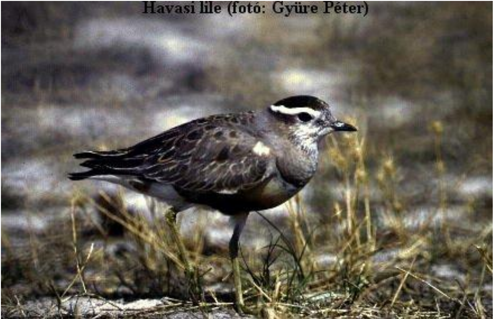
Havasi lile

Х Хрустан чуть больше воробья, Хрустана в тундре видел я.