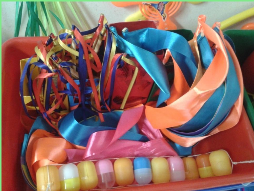
3. Сделали массажоры