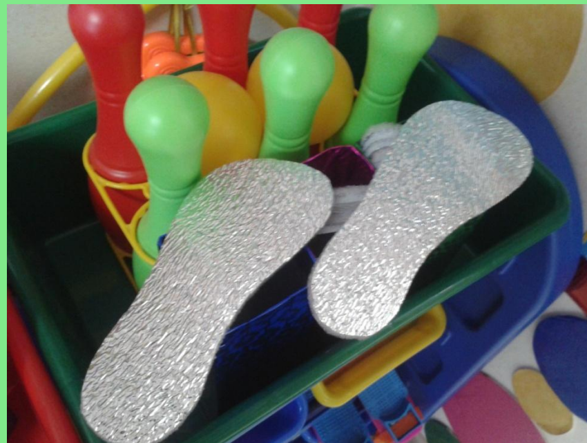
4. Сделали «следки»