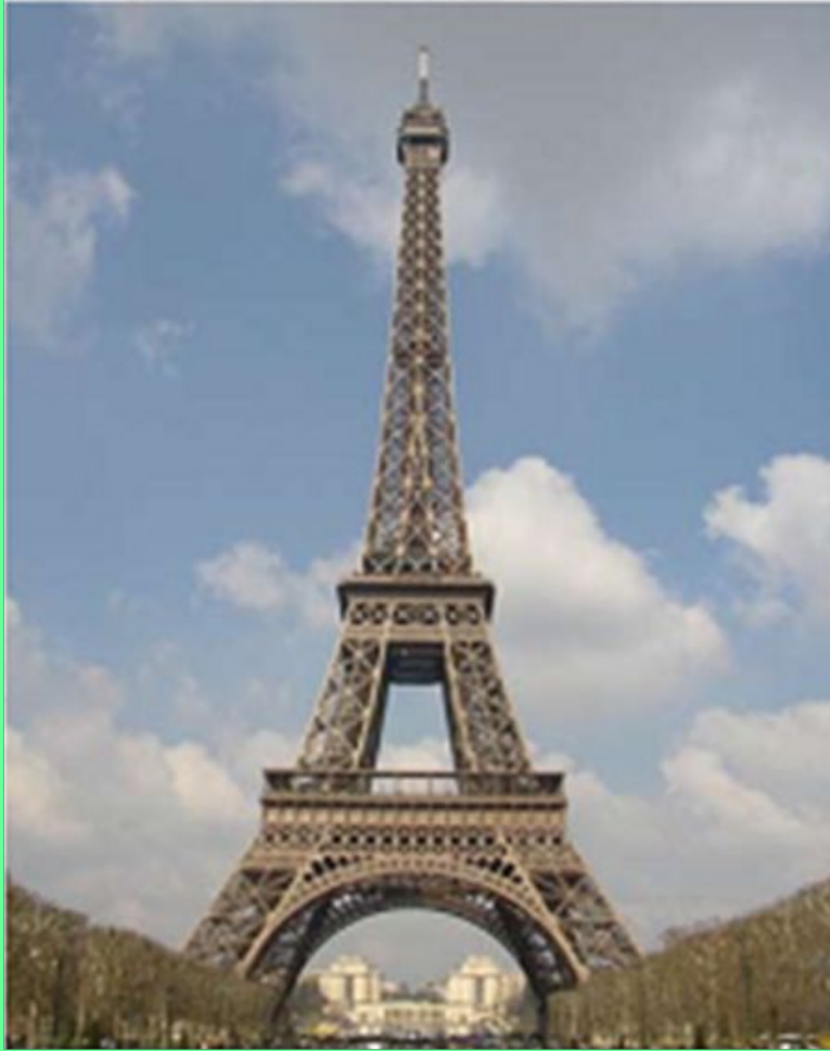
Эйфелева башня. Париж