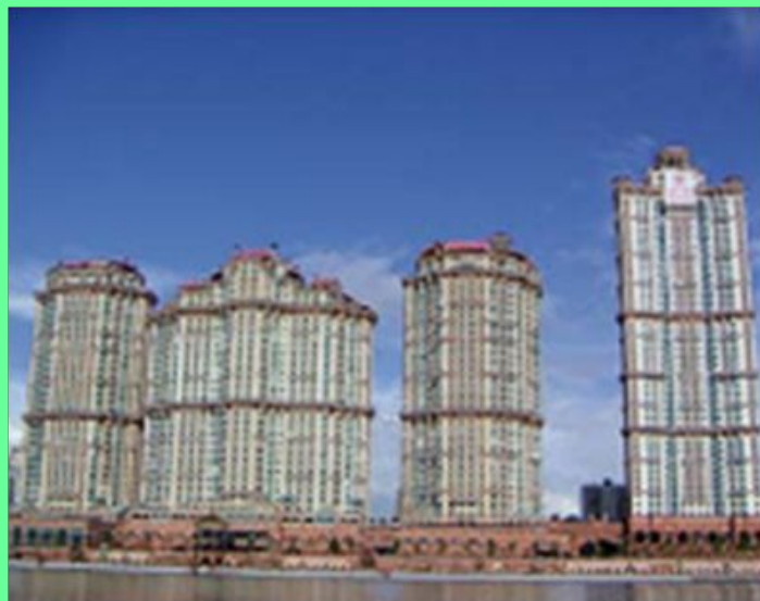
Жилой комплекс «Алые паруса». Москва

Однако культура современного мира в основном интернациональна, в ней все меньше и меньше остается места традиционным вкусам и представлениям. Сегодня на разных концах планеты люди пользуются одинаковыми предметами быта, носят похожую одежду, ездят на машинах одних и тех же марок, живут в типовых домах и квартирах, слушают одни и те же музыкальные произведения, смотрят одни и те же фильмы. Но несмотря на это каждый народ имеет свое неповторимое искусство.