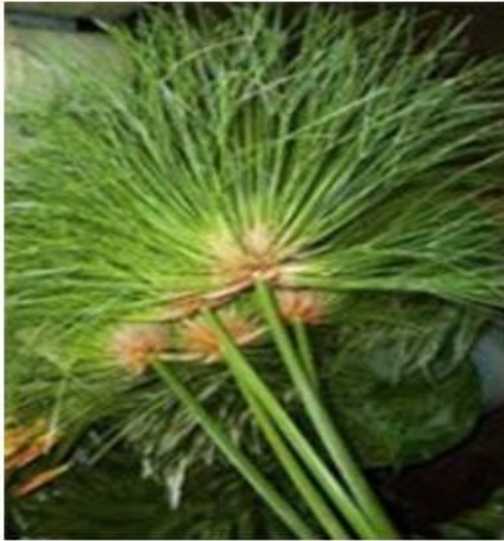
Стебли папируса Папирус – водный травяной цветок