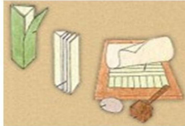
Процесс изготовления папируса В III ст. до н.э. техника изготовления папируса достигла высокого уровня.