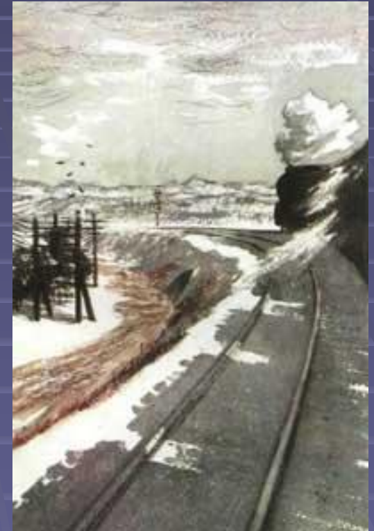
Иллюстрация к поэме «За далью -даль».

Поэма является исповедью современника, прошедшего вместе с народом путь испытаний и побед.