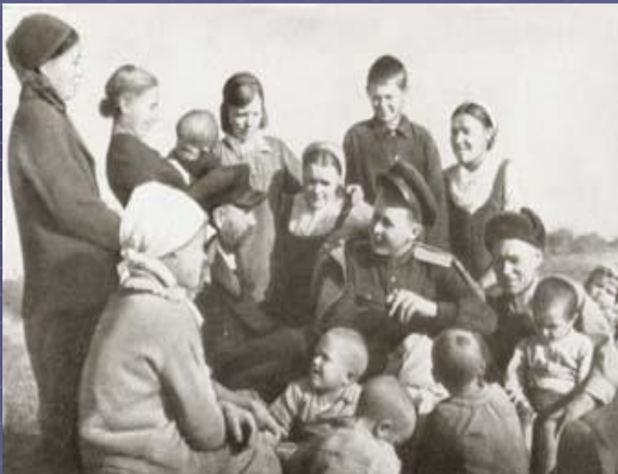
А.Т. Твардовский на Смоленщине 1943 год