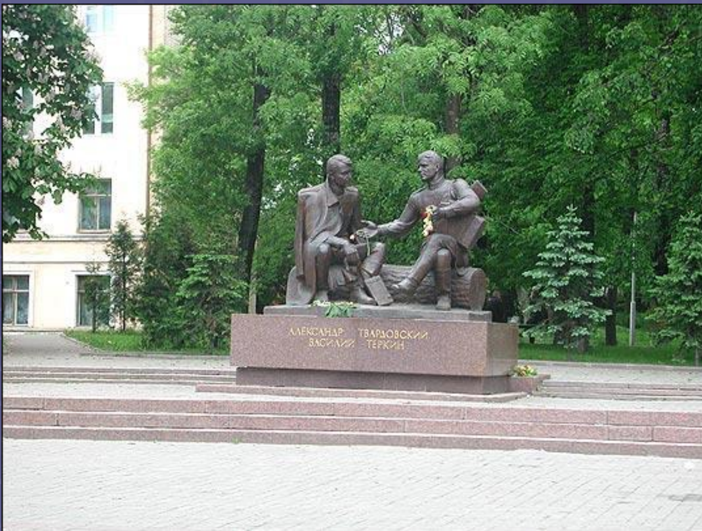
Памятник А.Т. Твардовскому и Василию Теркину в Смоленске