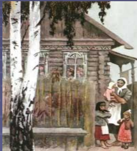
Иллюстрация к поэме «Дом у дороги»