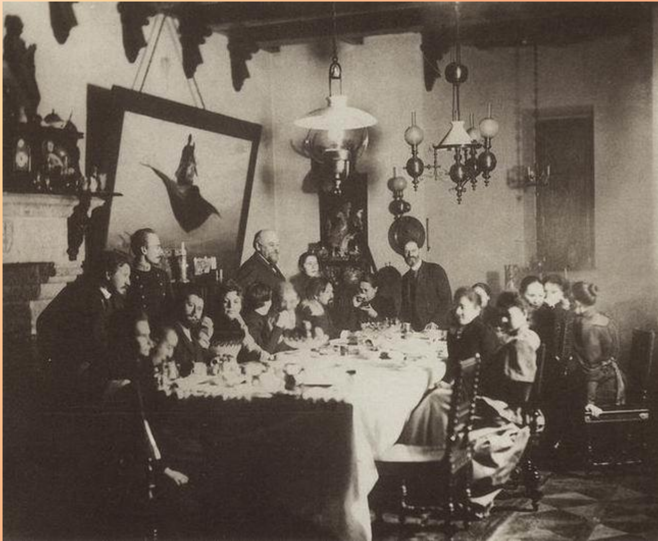
У Саввы Ивановича Мамонтова. 1889. На фотографии присутствуют – Серов, Коровин, Мамонтов