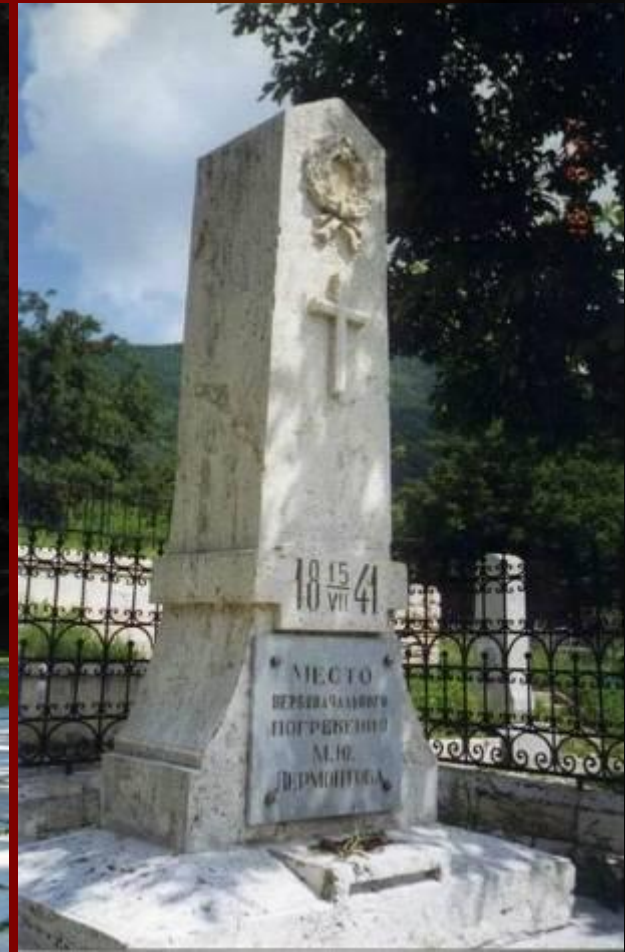
Место первого погребения