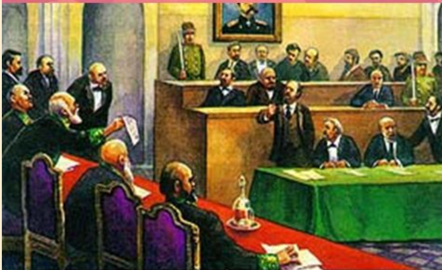
Суд присяжных при Александре II