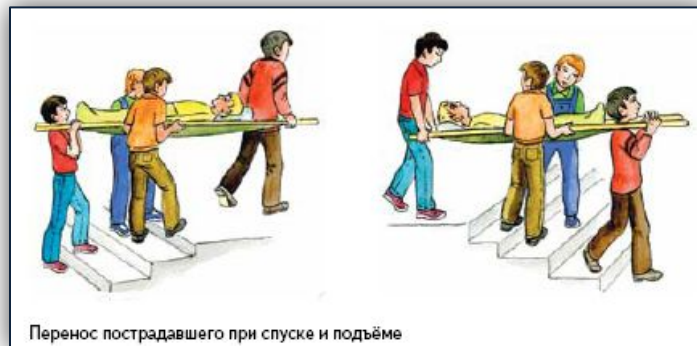
Перенос пострадавшего при спуске и подъёме