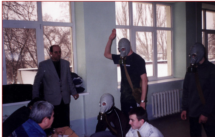
Выполнение нормативов по ГО в лицее №102