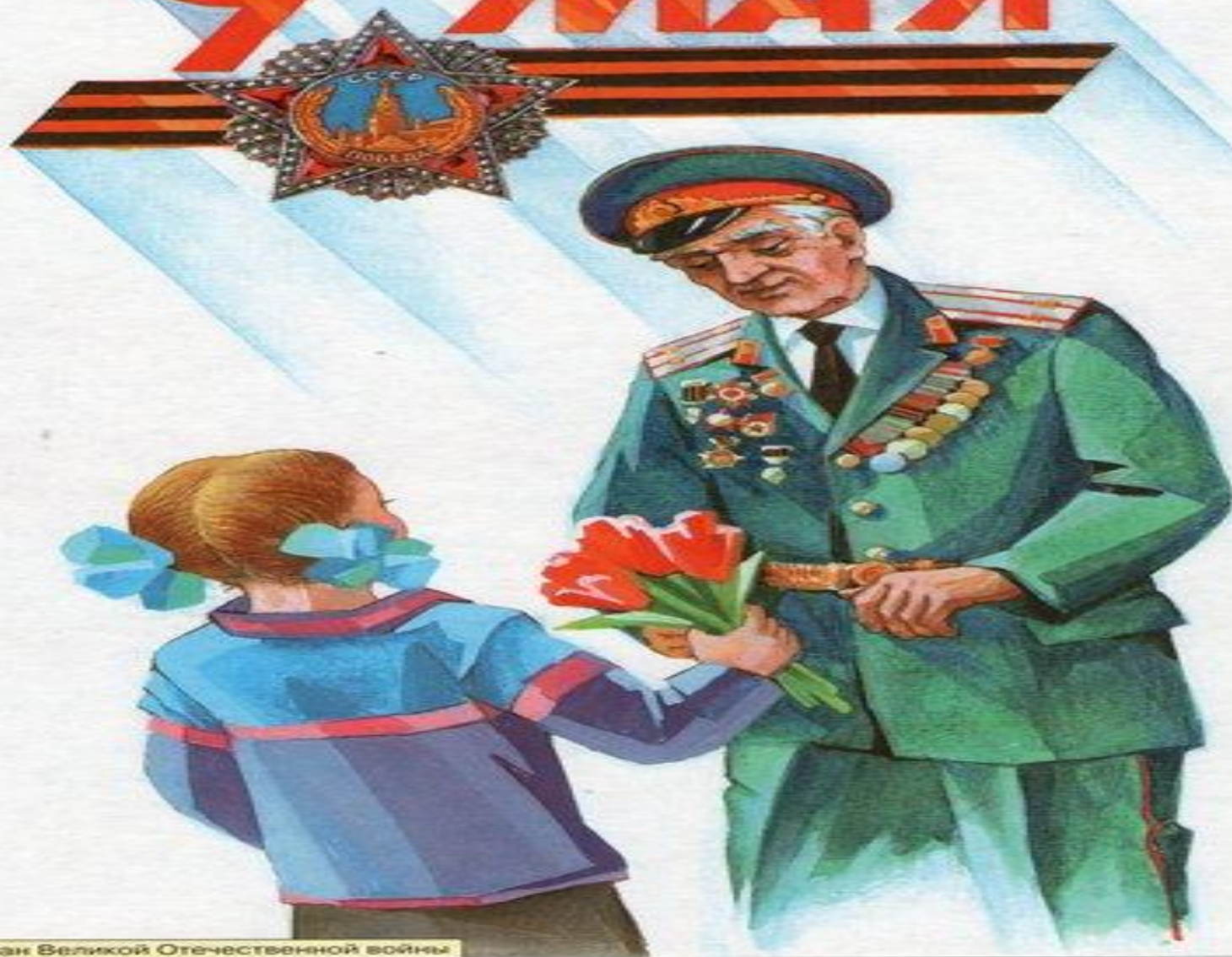
Ветеран Великой Отечественной войны