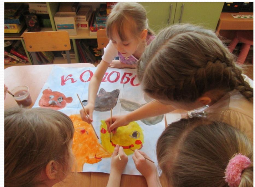
НОД :Рисование «Изготовление афиши к спектаклю «Колобок»