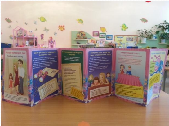
Ширма для родителей «Маршрут выходного дня»