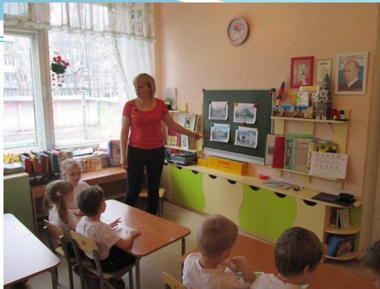
НОД : «Ознакомление с театрами города»