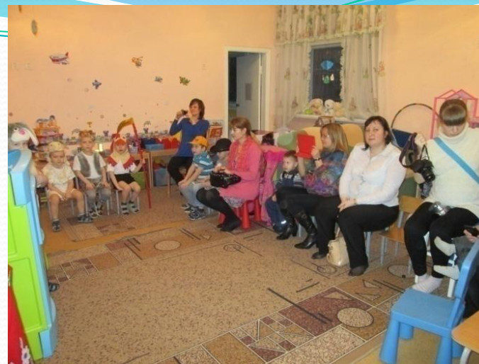
Сказка «Лубяная избушка» для родителей