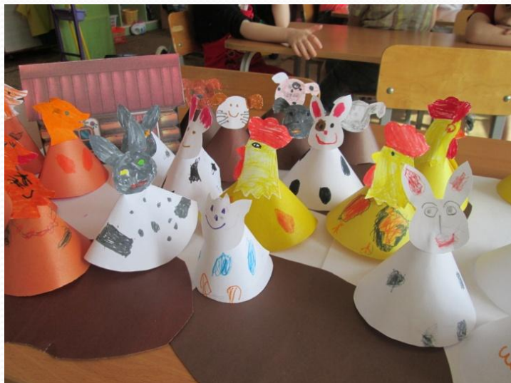
Конусный театр своими руками