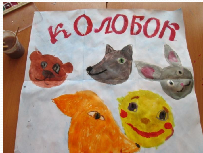
Афиша к спектаклю «Колобок»