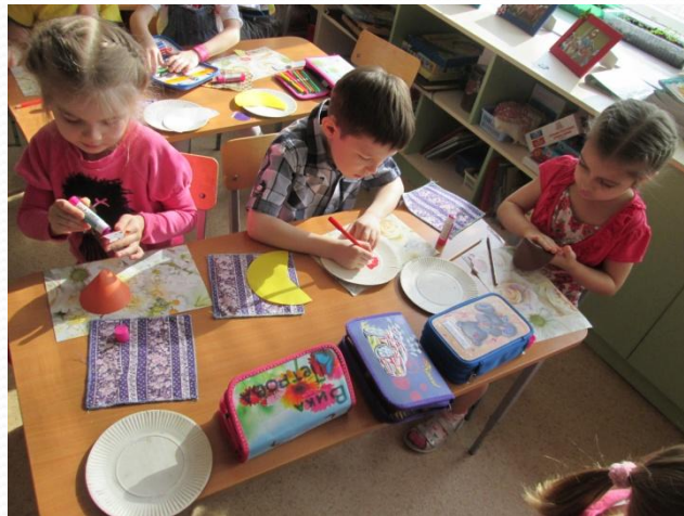
НОД Изготовление конусного театра «Лубяная избушка».Творческая мастерская «Театр своими руками»