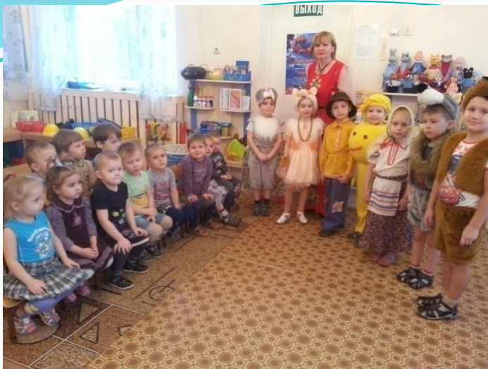
Сказка «Колобок» для малышей