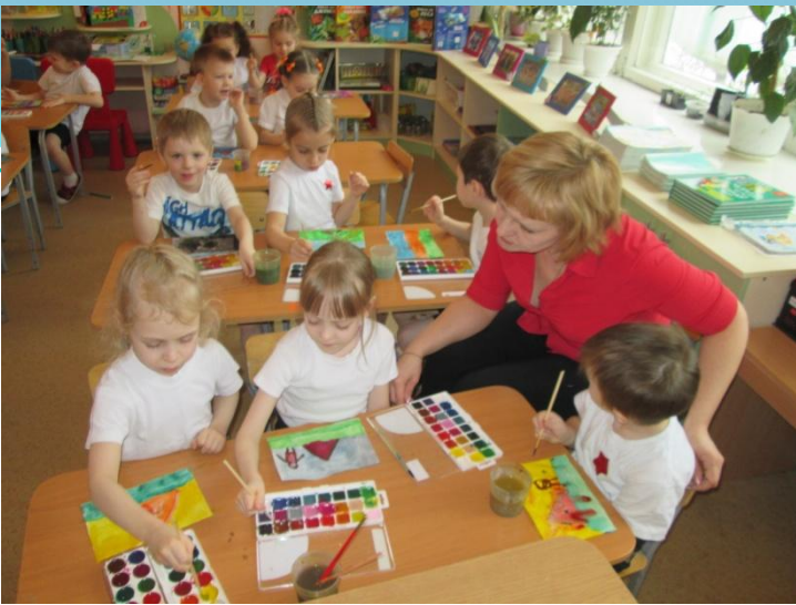
НОД «Изготовление приглашений билетов для малышей.»