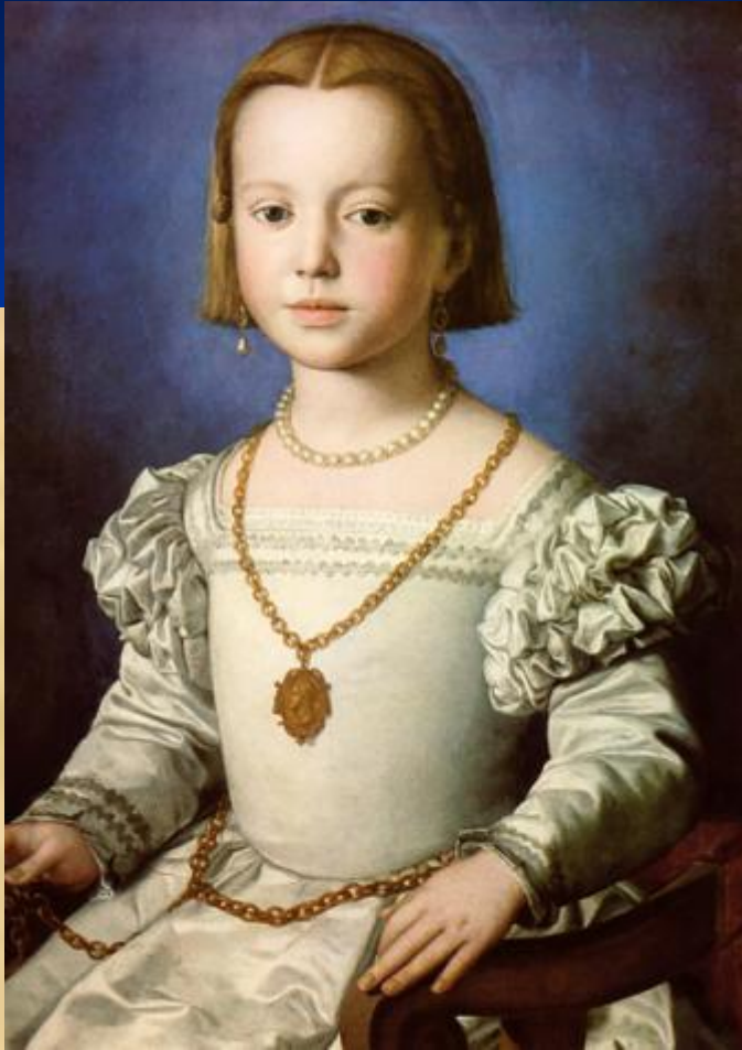
Портрет Изабеллы Медичи