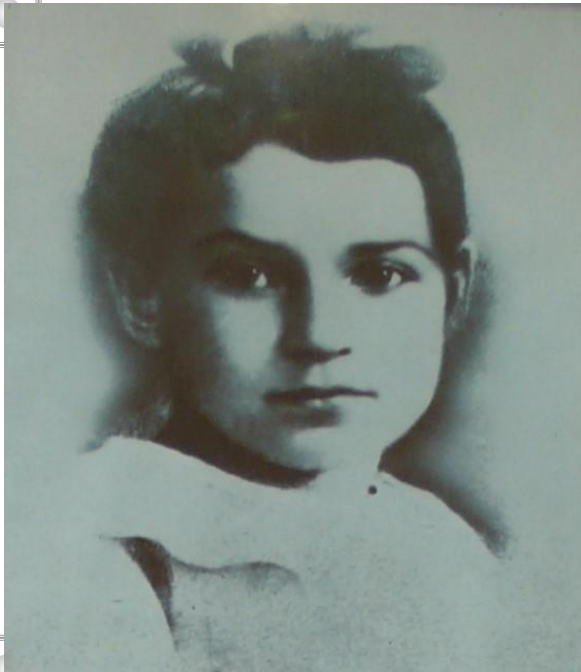
Фото 1938 года. Тане Савичевой 8 лет (до начала войны 3 года). Фотография в экспозиции Музея истории Ленинграда.