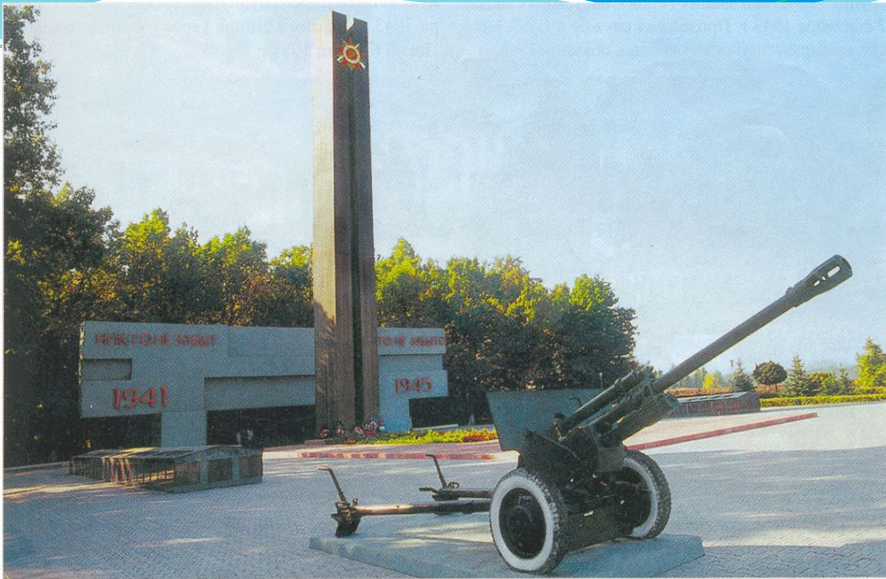
Братская могила в г. Старый Оскол