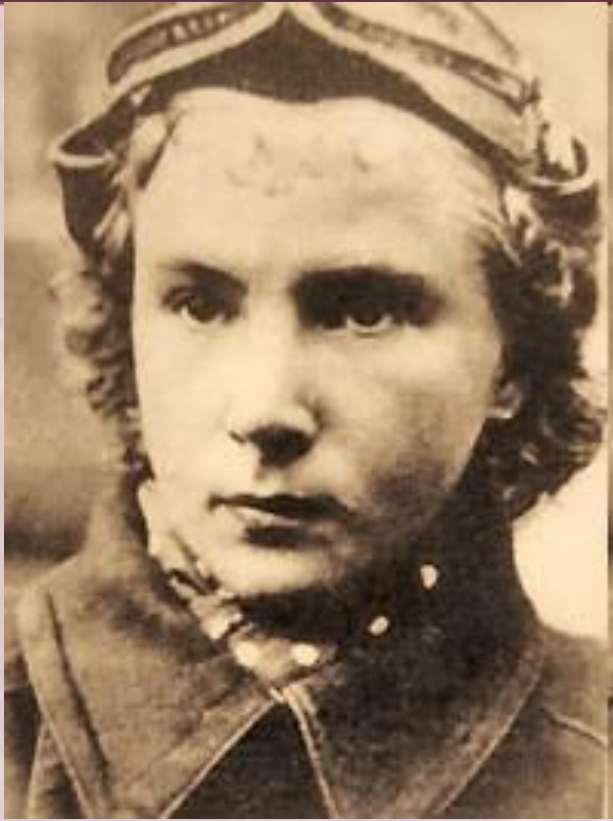
Герой Советского Союза Лидия Владимировна Литвяк. Самая результативная женщина-истребитель Второй Мировой. На её счету 14 сбитых самолётов противника.