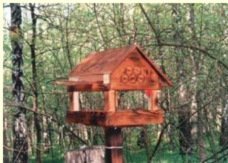
Домик - кормушка