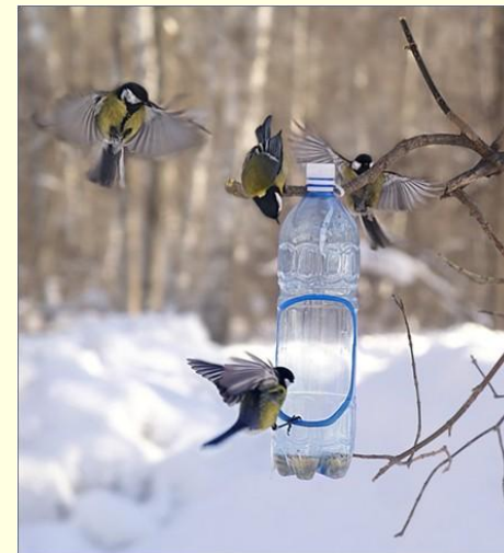
Бутылка - кормушка