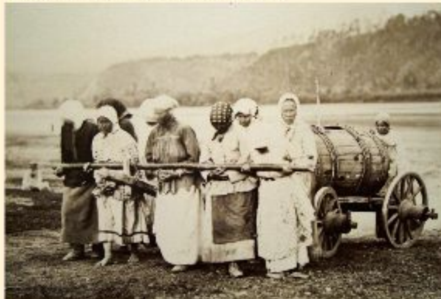
Каторга - Сибирь

Главная / Статьи / Статьи / Дореволюционный период