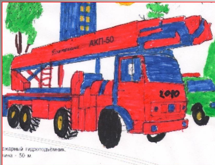
Экстренный гидротельферный лифт - 50 м.

Пожарные – люди, которые рискуя жизнью, борются с огнём.