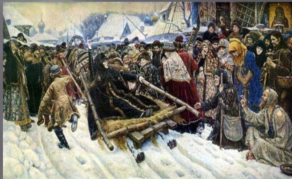
В.И. Суриков Боярыня Морозова