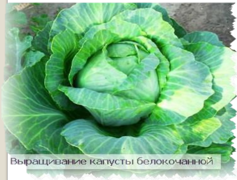
Выращивание капусты белокачанной

Ч еловек начал возделывать капусту более 5 тысяч лет назад, на что указывают данные археологических раскопок. Еще до новой эры это растение появилось в Древней Иберии, а впоследствии распространилось в Грецию, Египет, Рим.