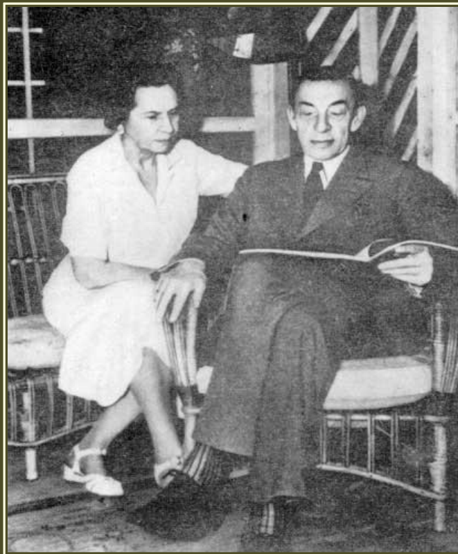
Наталья Александровна и Сергей Васильевич Рахманиновы на даче в Бeverли-Хиллс (1942)