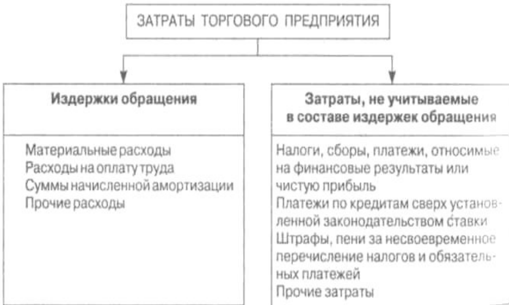
Рис. 1. Структура затрат торгового предприятия