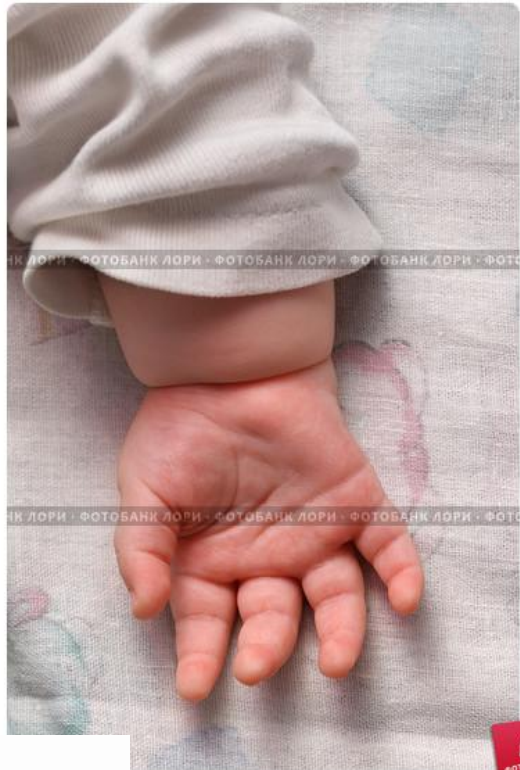
Детская ручка