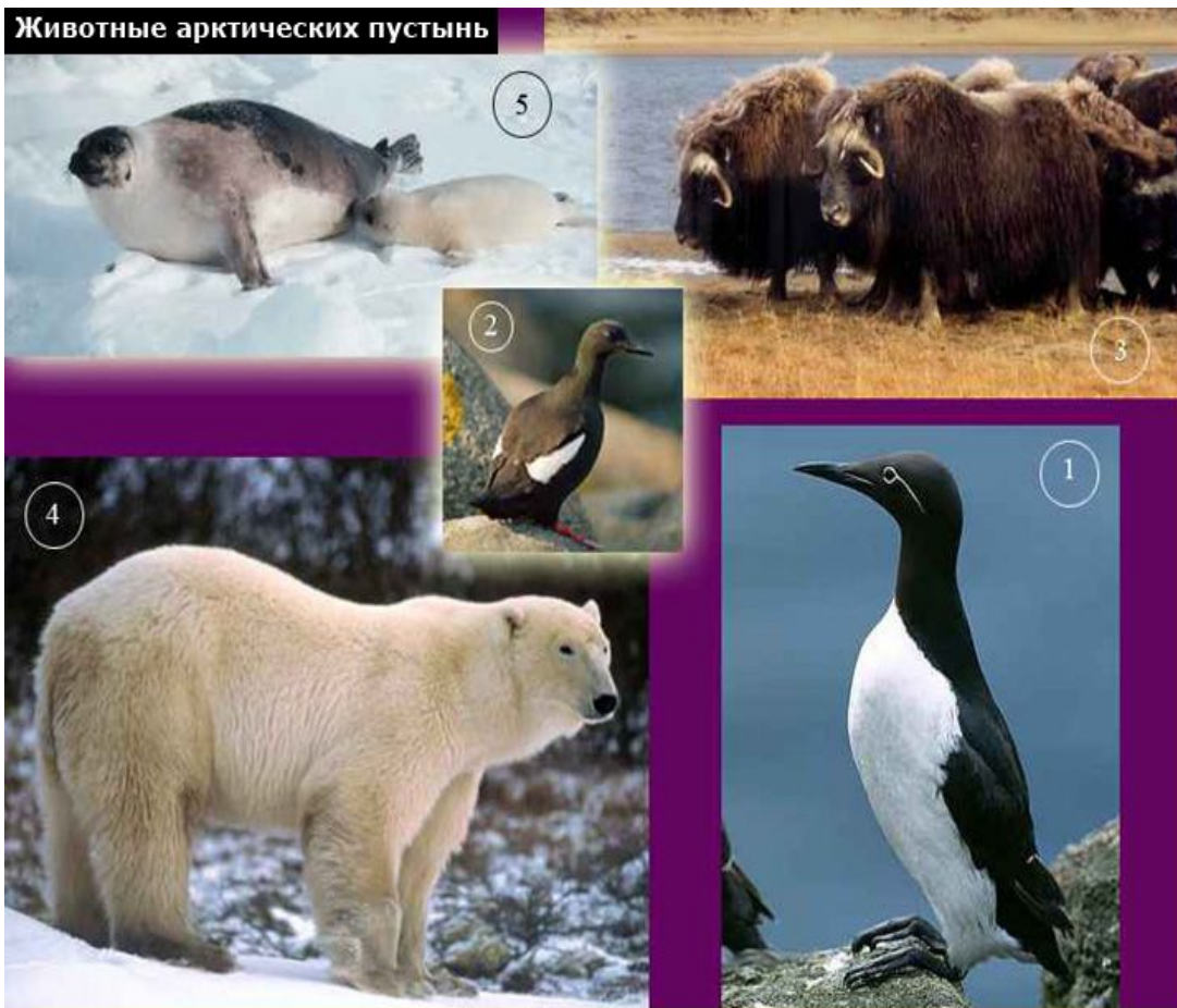
1.Кайра 2.Чистик 3.Овцебык 4.Белый медведь 5.Гренландский тюлень

Круглый год здесь преобладает арктический воздух, средние температуры июля 4-2^{\circ}\text{C} . Осадков выпадает 400-200 мм, причем почти все они выпадают в виде снега. Растительный покров крайне разрежен и пятнист, для него характерны бедность видового состава и исключительно низкая продуктивность. Доминируют лишайники, мхи, водоросли.