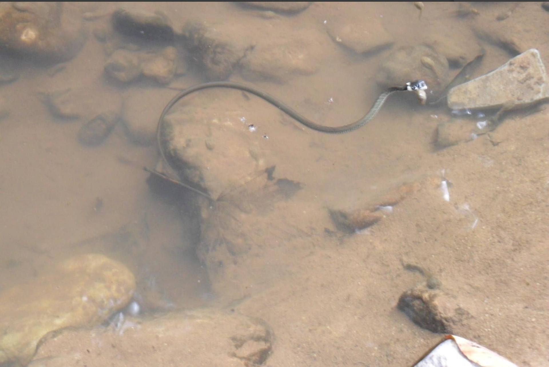
Удачная охота. Руфабго. Ужонок в лужице поймал головастика.