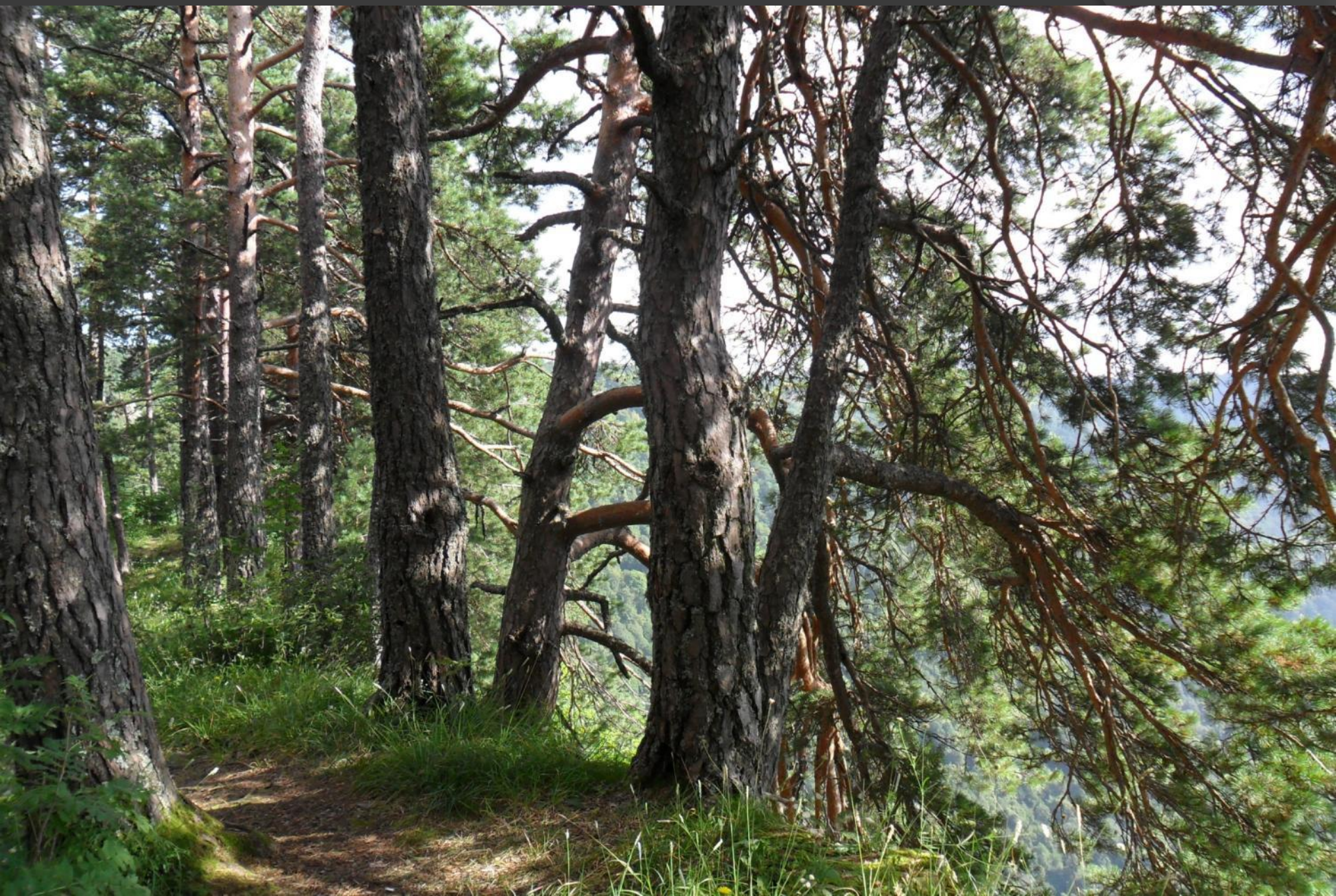
Сосны-великаны на краю ущелья...