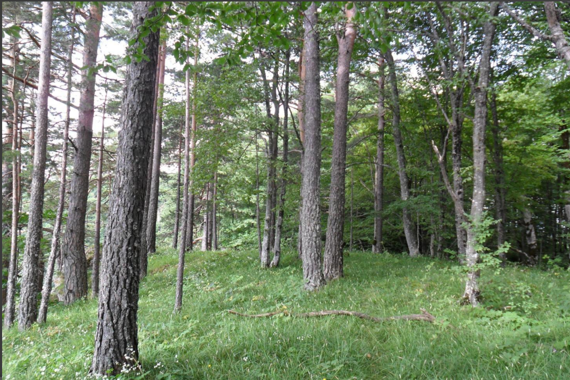
Лес . Хребет Азиш-Тау