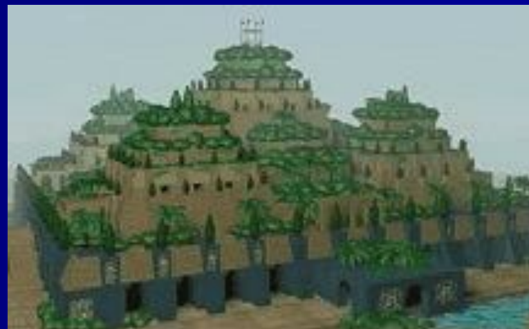
Висячие сады Семирамиды