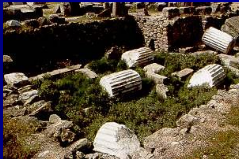
МАВЗОЛЕЙ В ГАЛИКАРНАСЕ