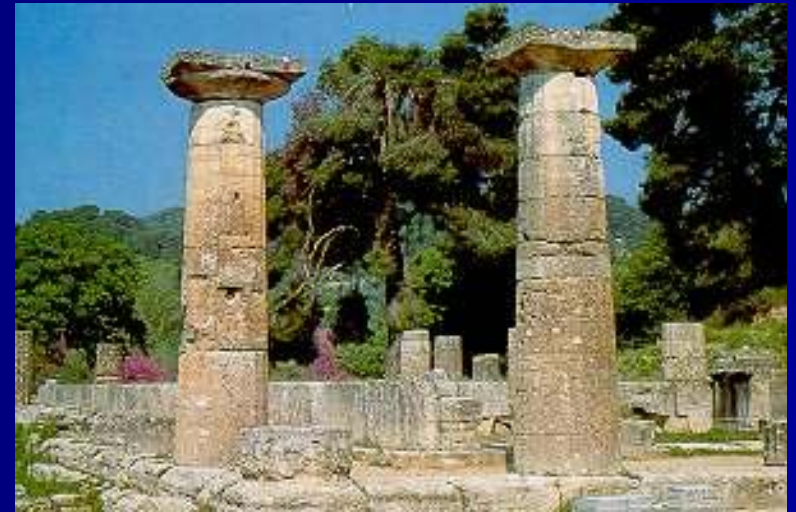
Статуя Зевса Олимпийского