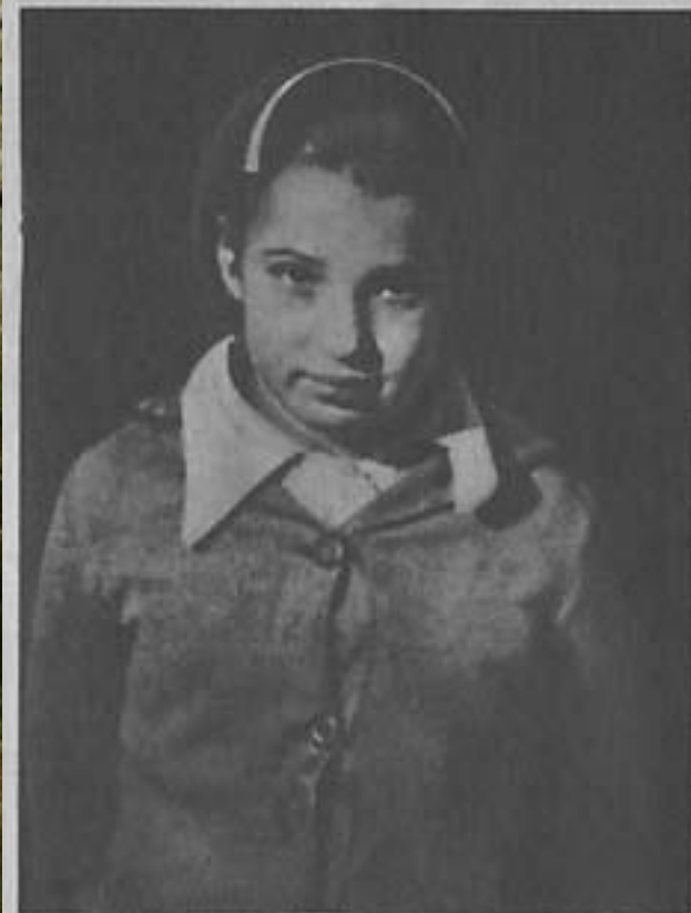
Таня Савичева. Фрагмент группового снимка