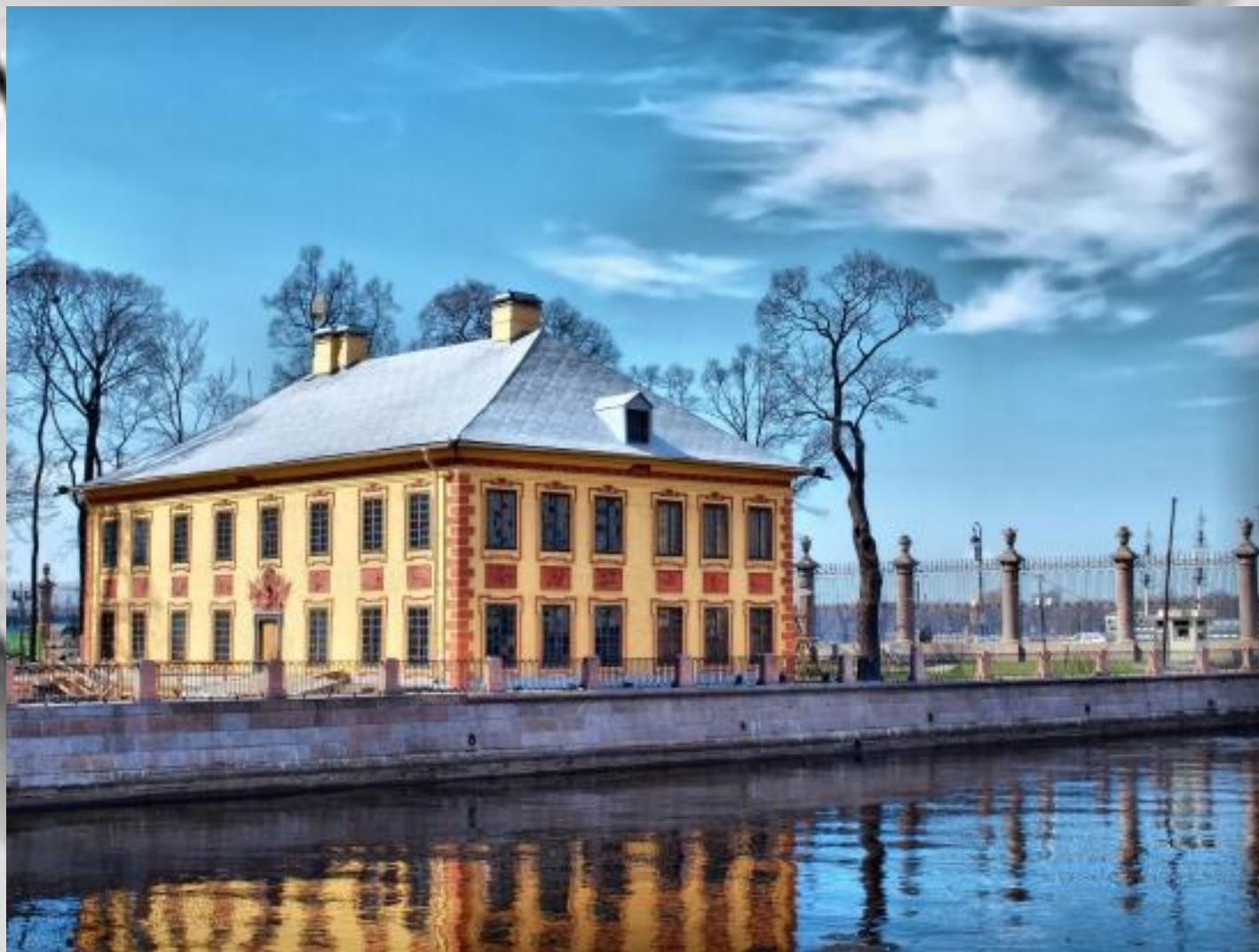
Домик Петра I