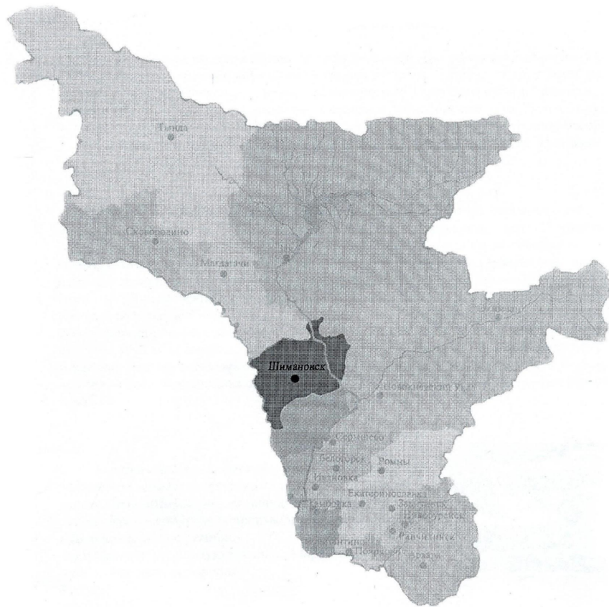
Амурская область город Шимановск