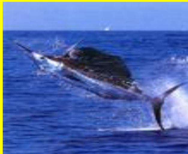
рыба - меч