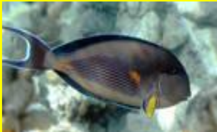
рыба - хирург