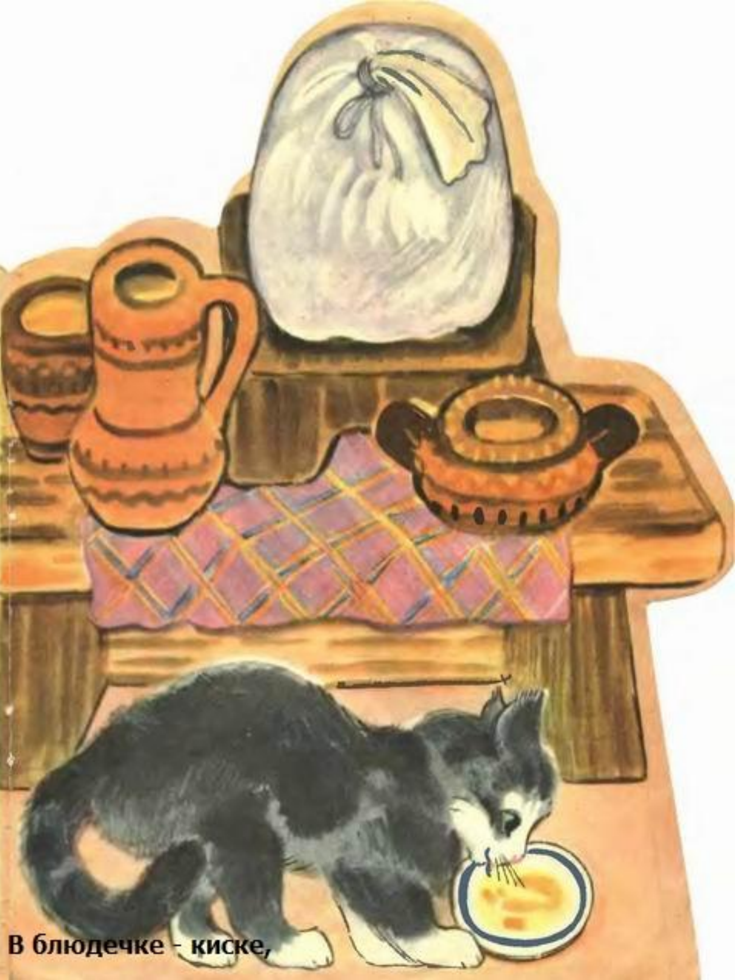
В блюдечке - киске,