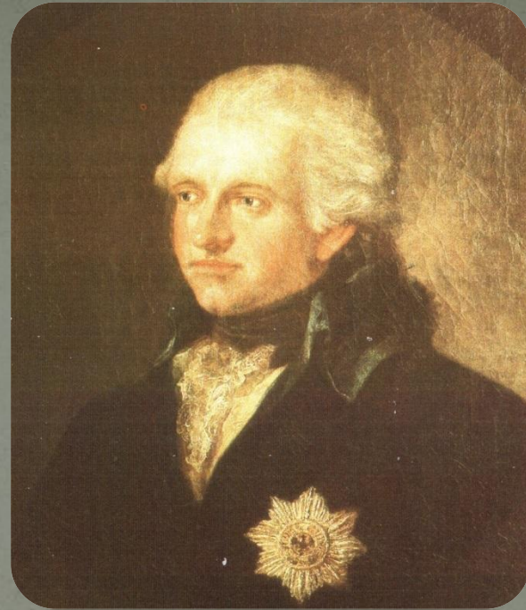
Herzog Karl August

Der große deutsche Dichter Johann Wolfgang von Goethe siedelte im Jahre 1775 nach Weimar auf Einladung der Herzogs Karl-August über.