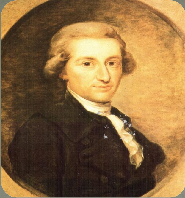
Johann Wolfgang von Goethe