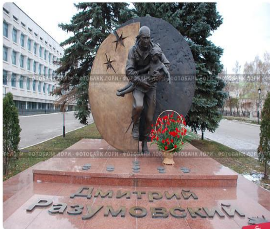
Памятник спецназовцу. Ульяновск.