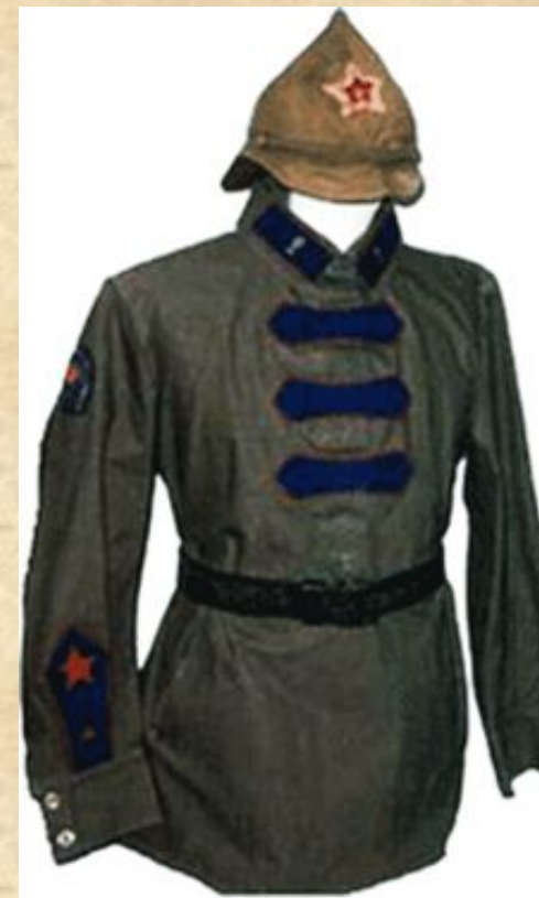
Форма сотрудника ОГПУ

Председателем ГПУ и позже ОГПУ до 20 июля 1926 года являлся Ф. Э. Дзержинский , затем до 1934 года ОГПУ возглавлял В. Р. Менжинский .