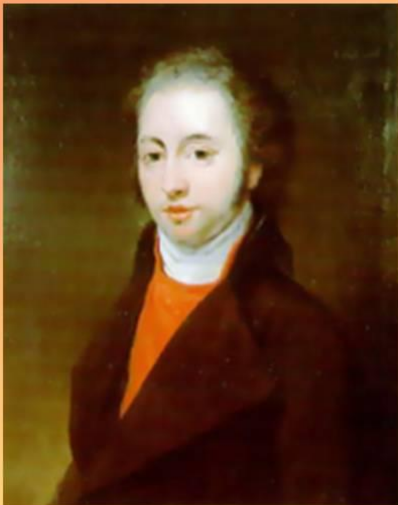
И.Н. Тютчев. Отец поэта.