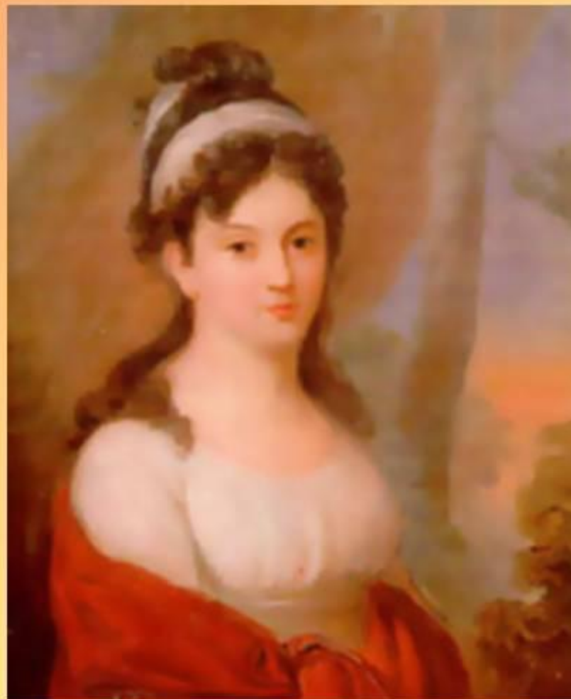
Е. Л. Тютчева. Мать поэта.