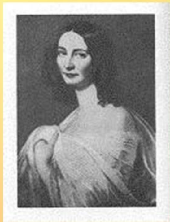
Эрнестина Фёдоровна Тютчева (Пфеффель) вторая жена поэта