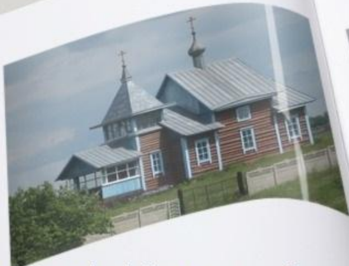
Церковь в д. Капыревщина