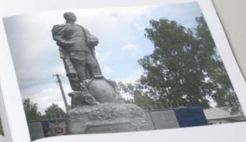
Памятник на б. м. в д. Капыревщина Ярцевского района