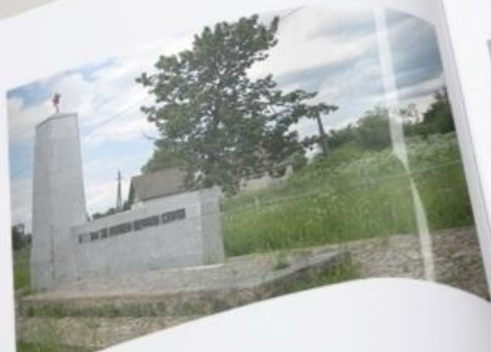
Могила бойцам 166 с.д. и жителям д. Верховье (фамилии не указаны)