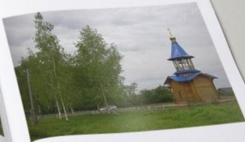
Церковь архистратига Михаила, построенная томскими студентами