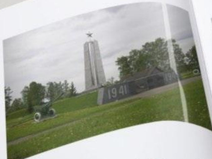
Мемориал 166 с.д.