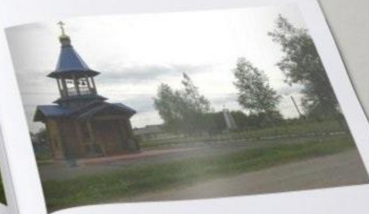
Общий вид церкви и мемориала