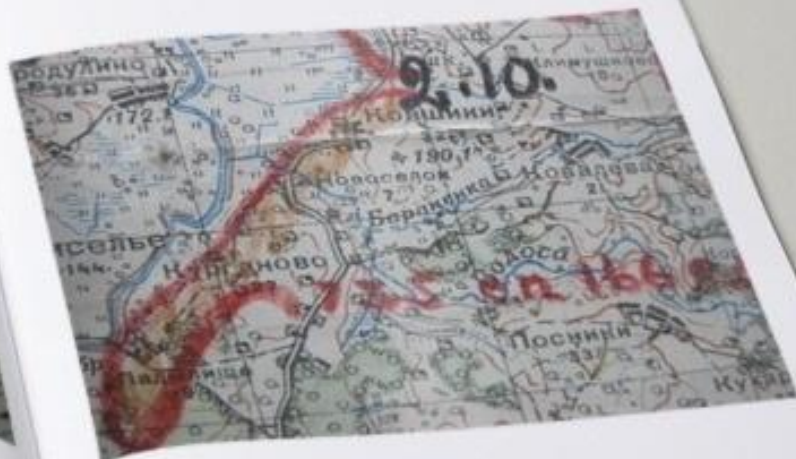
Расположение 735 с.п. со 2-5.10.1941 г.