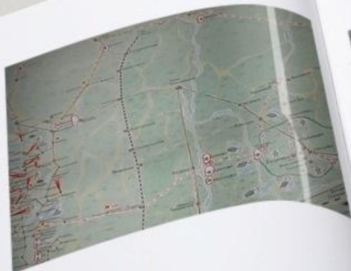
Карта боевого пути 166 с.д.