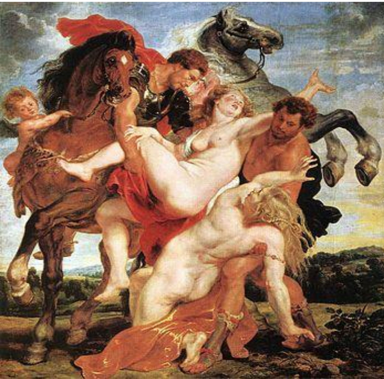
Похищение дочерей Левкиппа