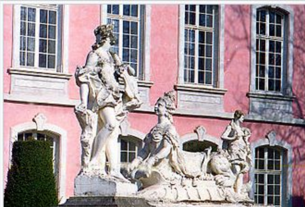
Трир. Барочный сфинкс у дворца курфюрста