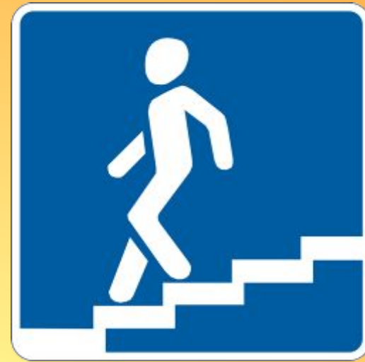
Подземный пешеходный переход.