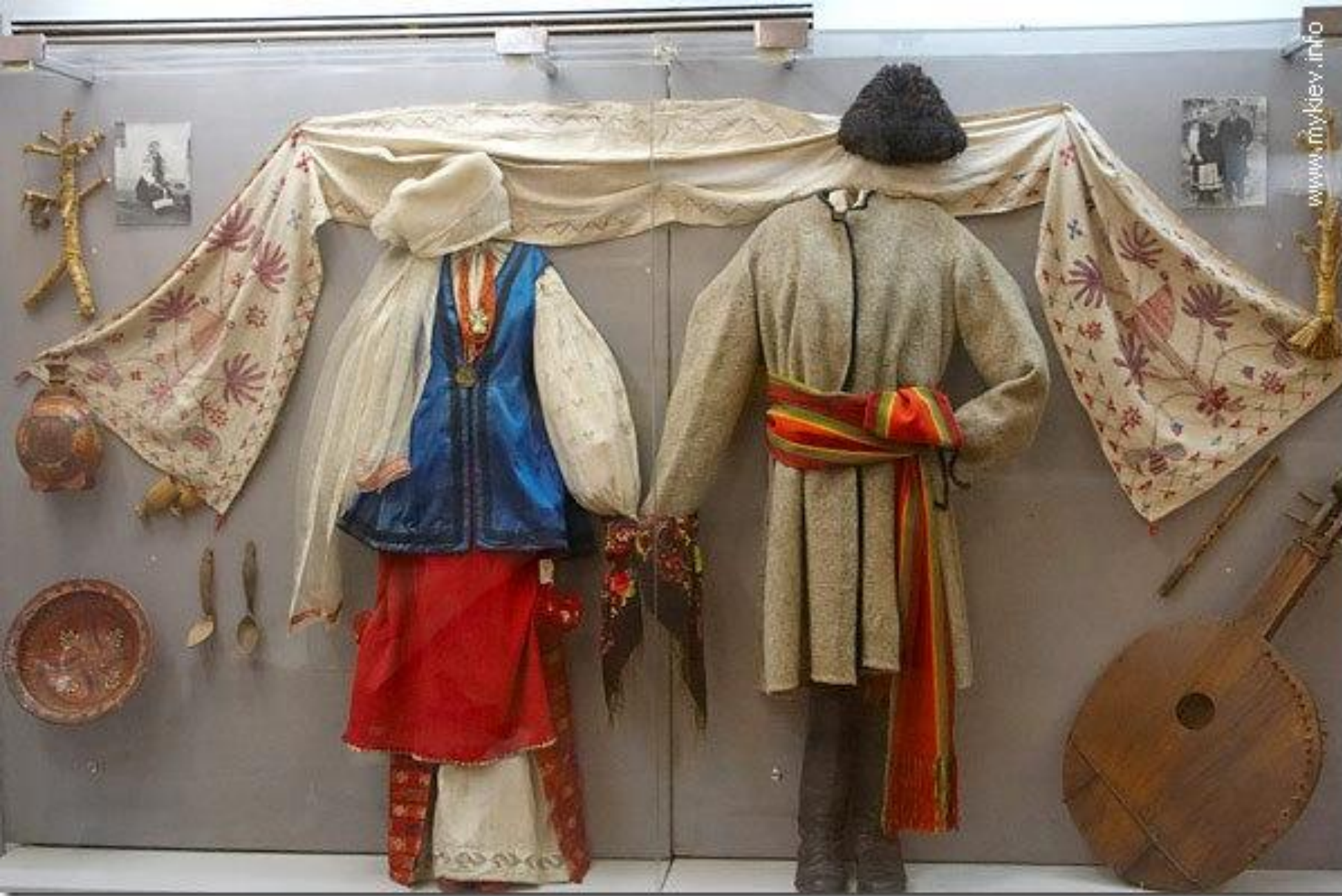
Одежда крестьян в 19 веке