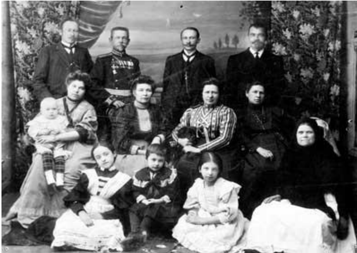
Семья купца Унженина

Основная масса купечества по-прежнему соблюдала традиционные уклад жизни. В домах сохранялась строгая субординация по «Домострою». Жила обычная купеческая семья общим хозяйством, закупая материал на одежду «штуками», на всех. Касса предприятия или заведения долгое время также была общей.