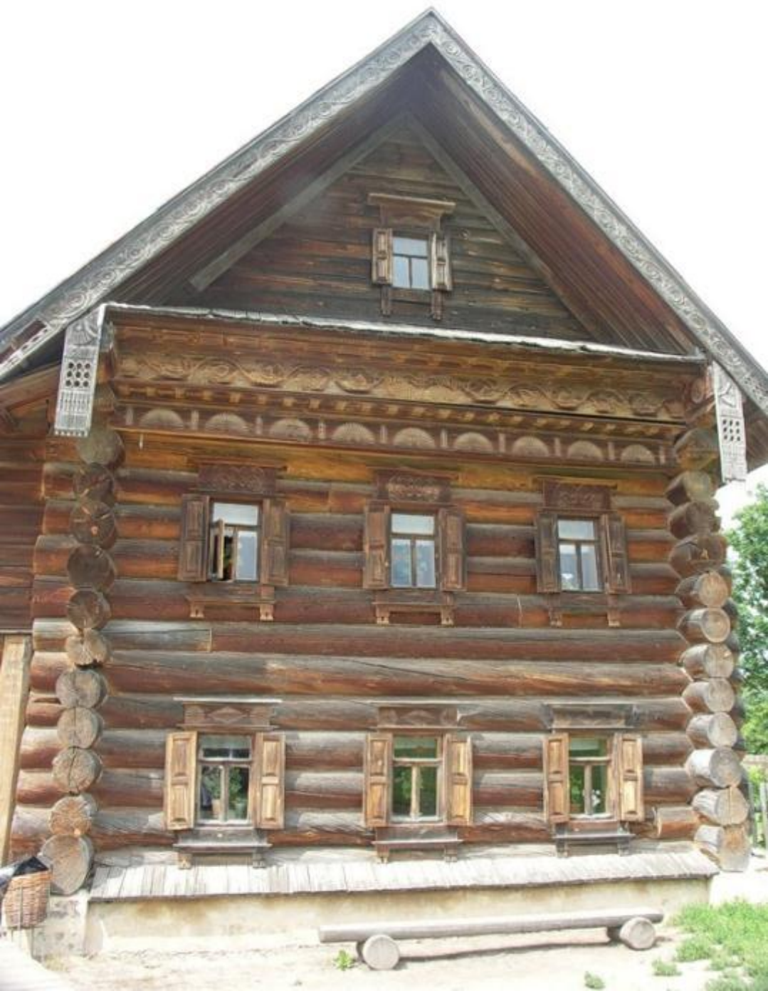
Дом зажиточного крестьянина