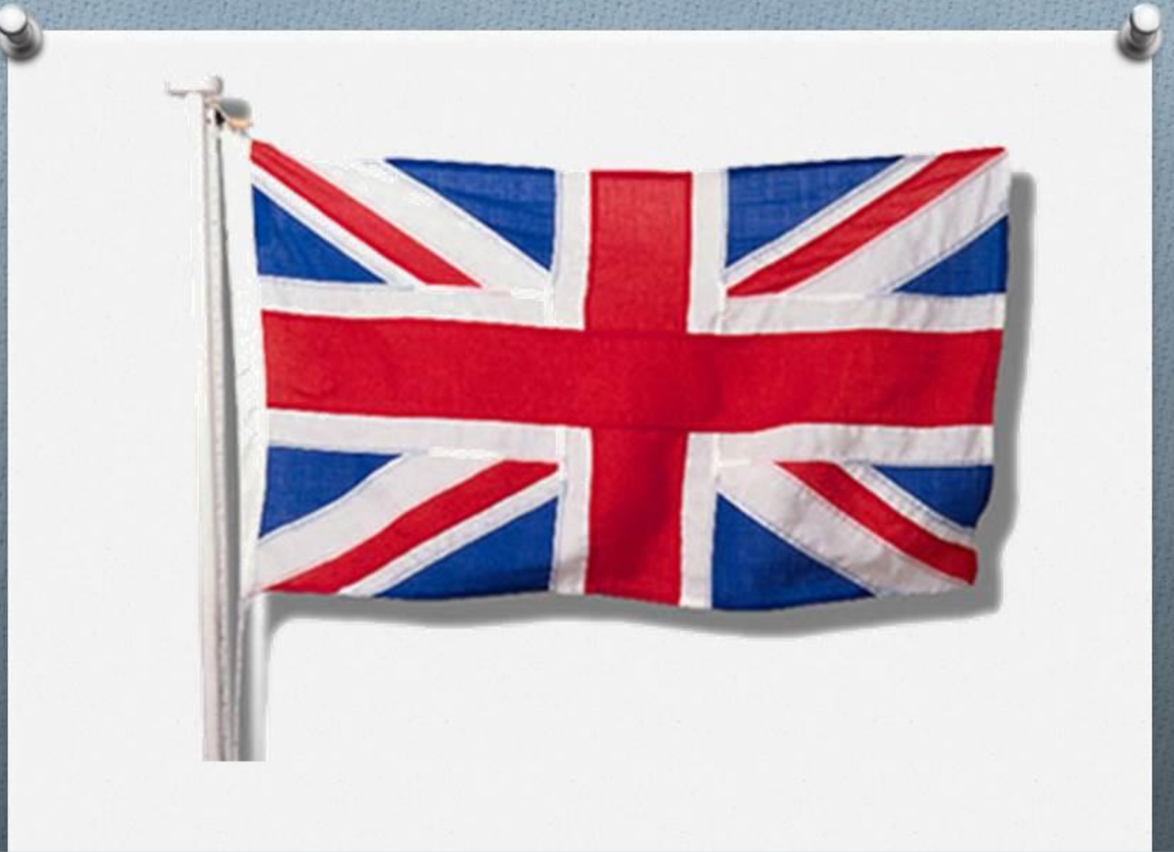
Флаг Великобритании - синее полотно с красными перекрещивающимися полосками.