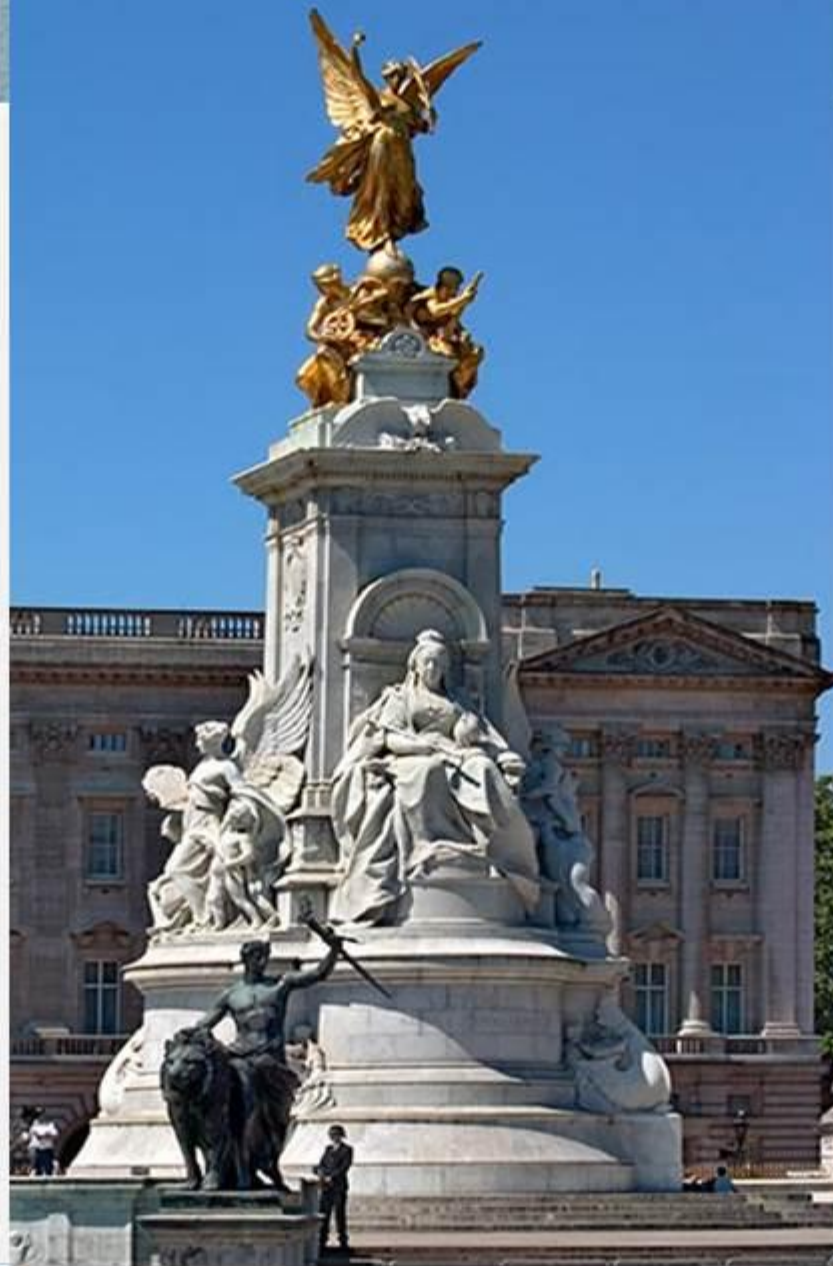
На площади возле дворца находится мемориал Королевы Виктории