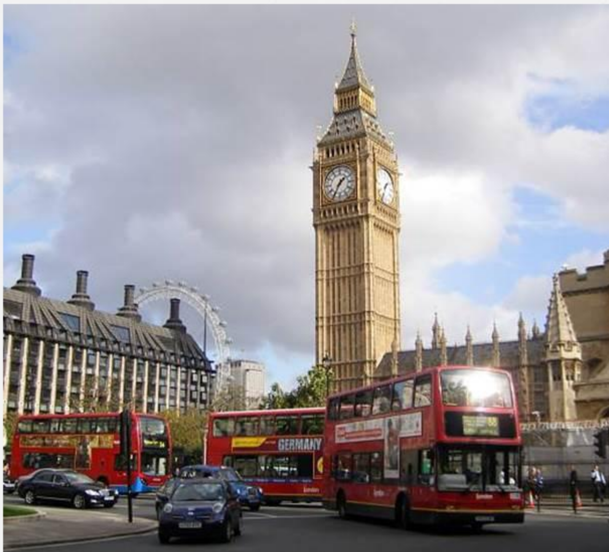
Старинная башня с часами Биг Бен (Big Ben)