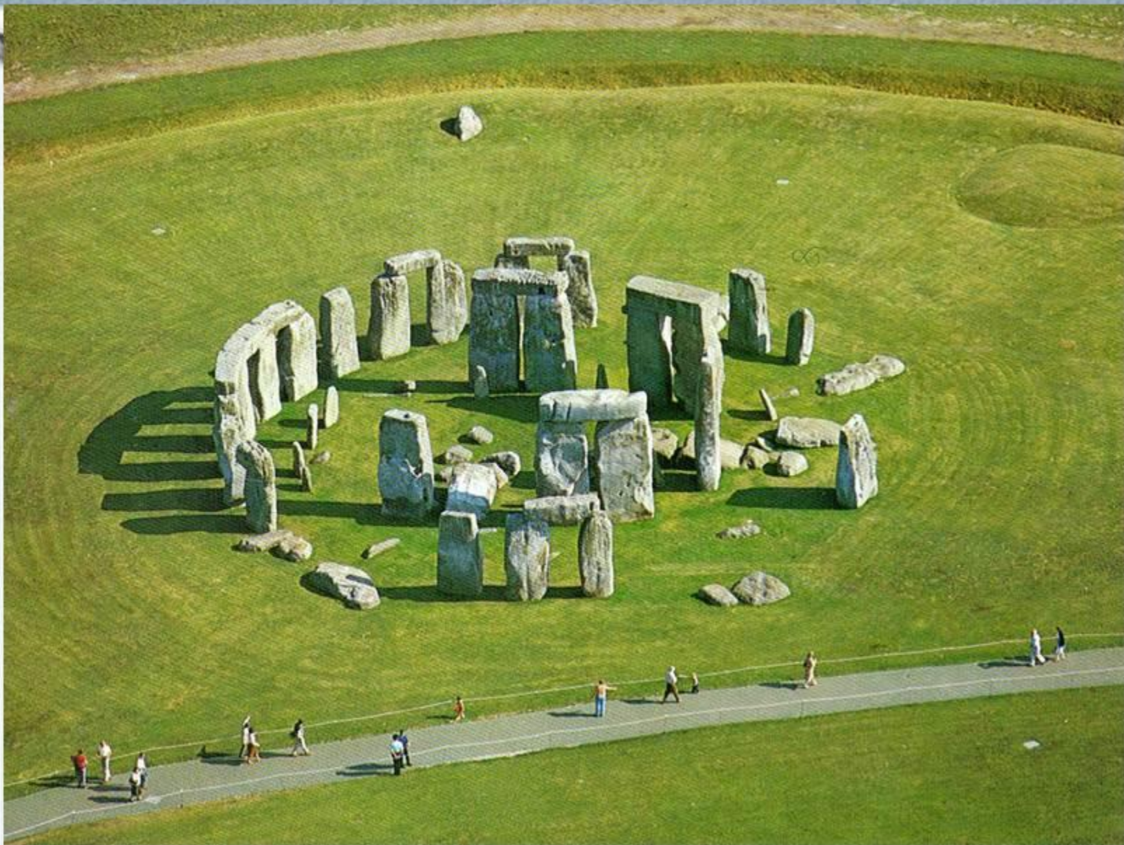
Доисторическое собрание каменных глыб - Стоунхендж