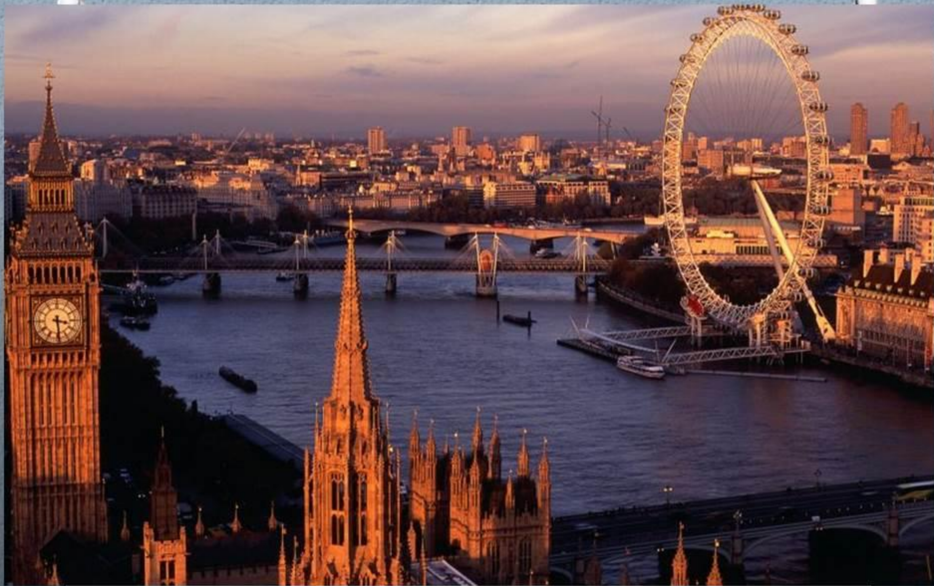
Столица Британии – Лондон.