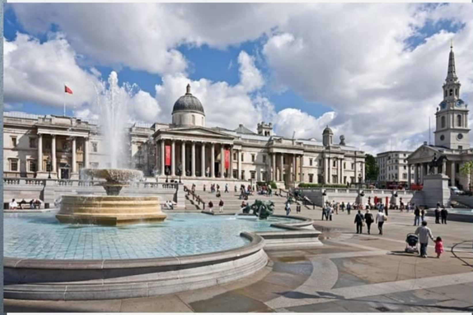
Достопримечательности Великобритании - Трафальгарская площадь