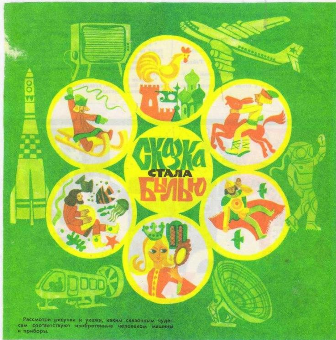
Рассмотри рисунки и укажи, каким сказочным чудесам соответствуют изобретенные человеком машины и приборы.