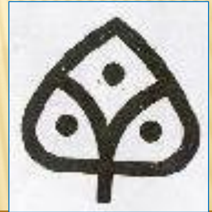
Южноуральский фарфоровый завод