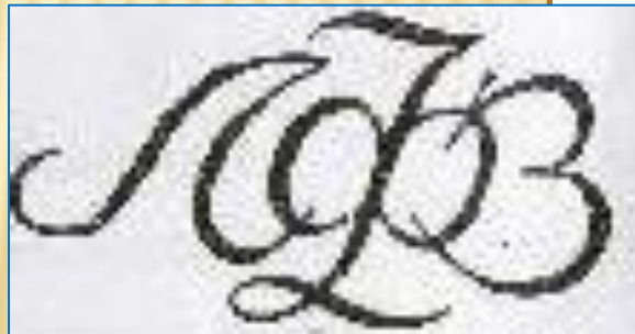
Ленинградский фарфоровый завод