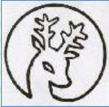
Артёмовский опытно- экспериментальный завод