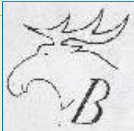
Дмитровский фарфоровый завод