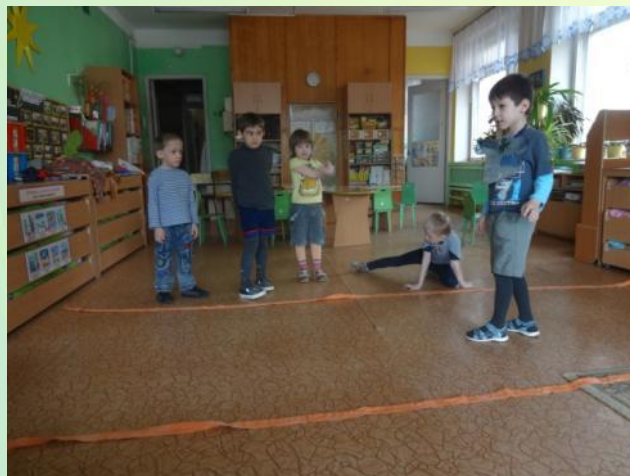
Волк во рву