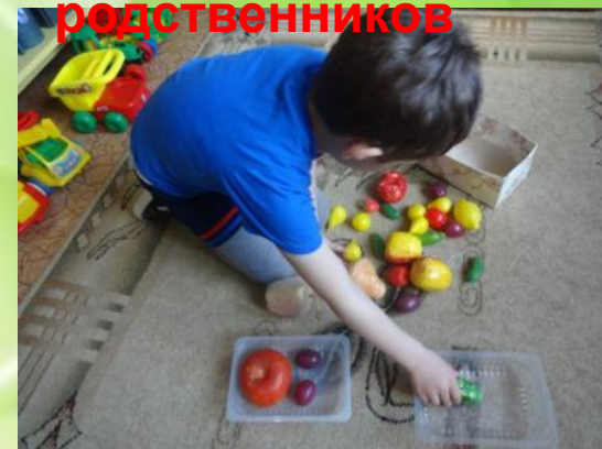
Разложи по группам