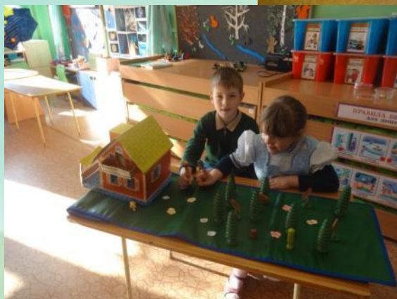
В какую игру я