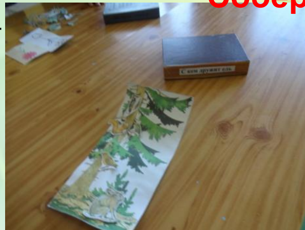
С кем дружит ель