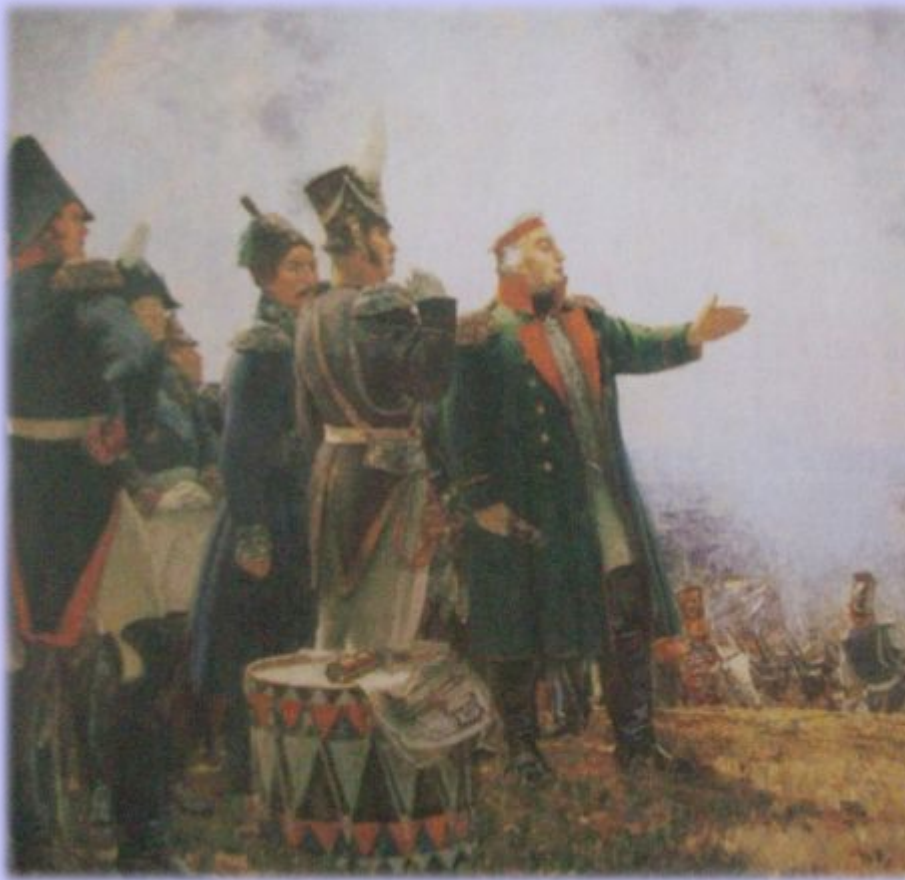
М.И.Кутузов на Бородинском поле. Худ. С.Герасимов. 1952 г.

конницу генерала Ф. П. Уварова и казаков атамана М. И. Платова. Наполеон два часа потратил на ликвидацию угрозы.