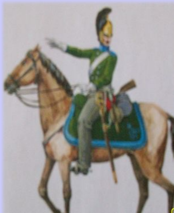
Рядовой Новороссийского драгунского полка