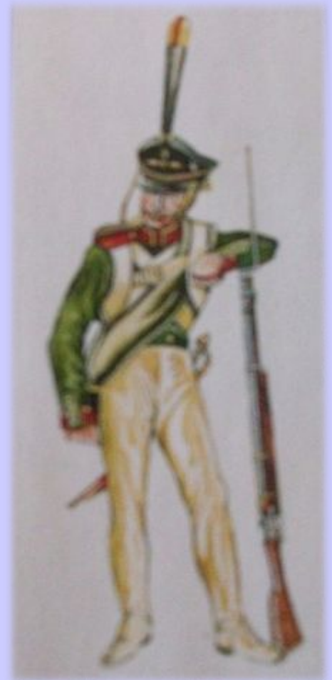
Унтер-офицер Екатеринославского гренадерского полка