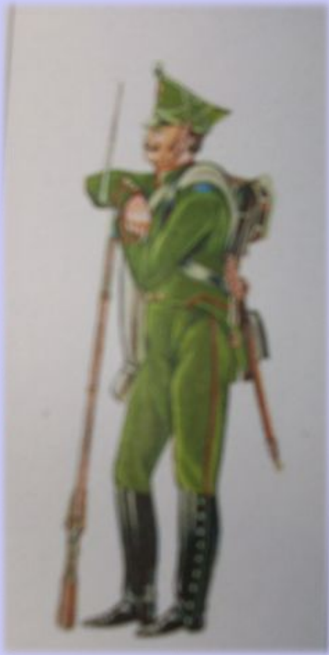
Рядовой Егерского полка