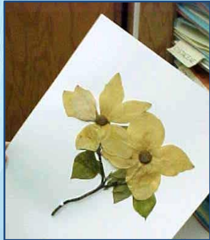
Засушенный цветок. (А. С. Пушкин. «Цветок»)