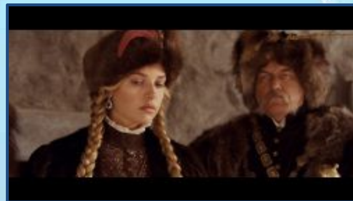
Н. В. Гоголь «Тарас Бульба», Панночка

«...Она была бледна, но белизна ее была пронзительна, как сверкающая одежда серафима. Гебеновые брови, тонкие, прекрасные, придавали что-то стремительное ее лицу, обдающее священным трепетом сладкой боязни в первый раз взглянувшего на нее. Ресницы ее, длинные, как мечтания, были опущены и темными тонкими иглами виднелись резко на ее небесном лице. Что это было за создание!