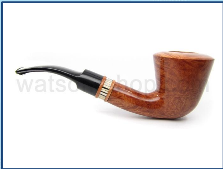
Трубка (люлька). (Н.В. Гоголь. «Тарас Бульба»)