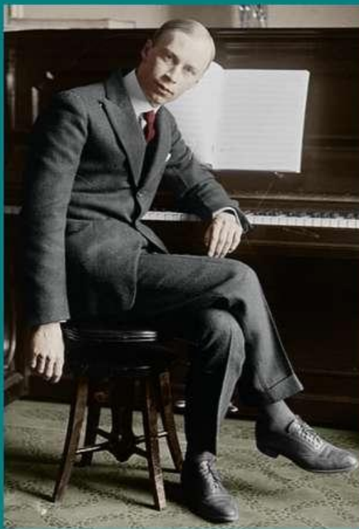
Прокофьев Сергей Сергеевич