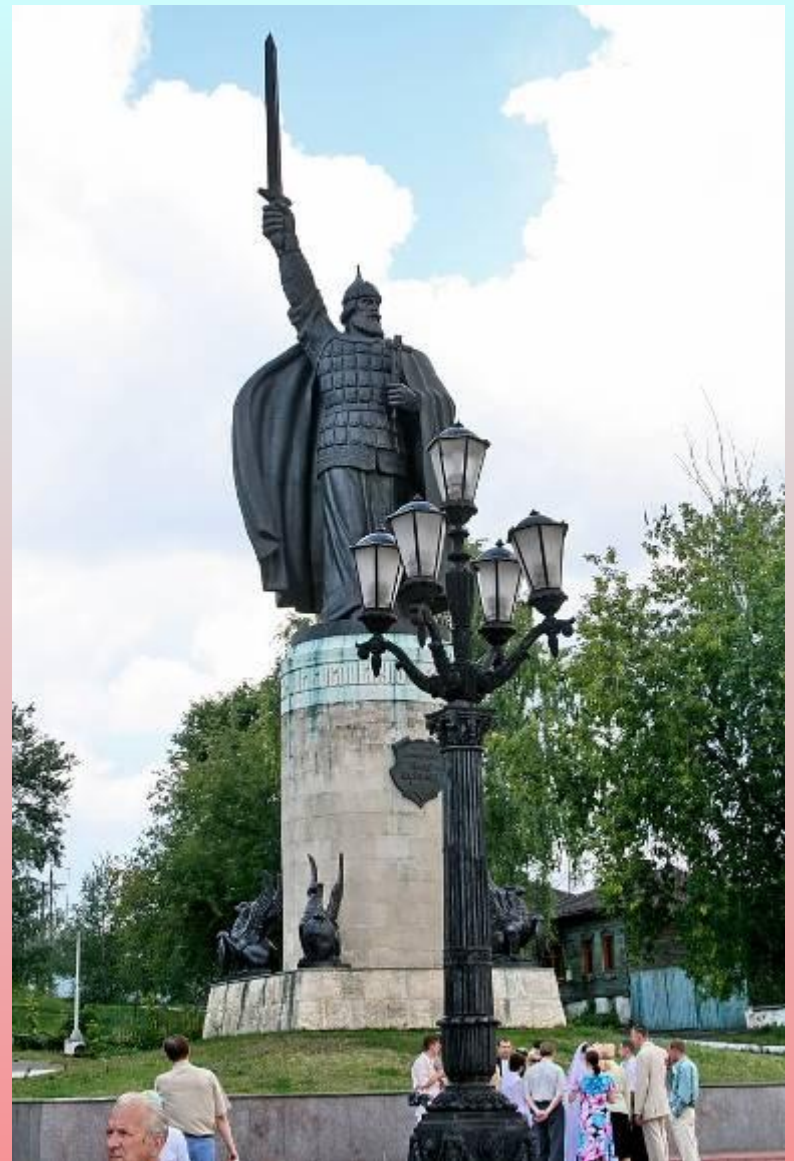
Памятник Илье Муромцу

Здесь дружины храбрые В бой вели князя, Конного и пешего Недруга разя.