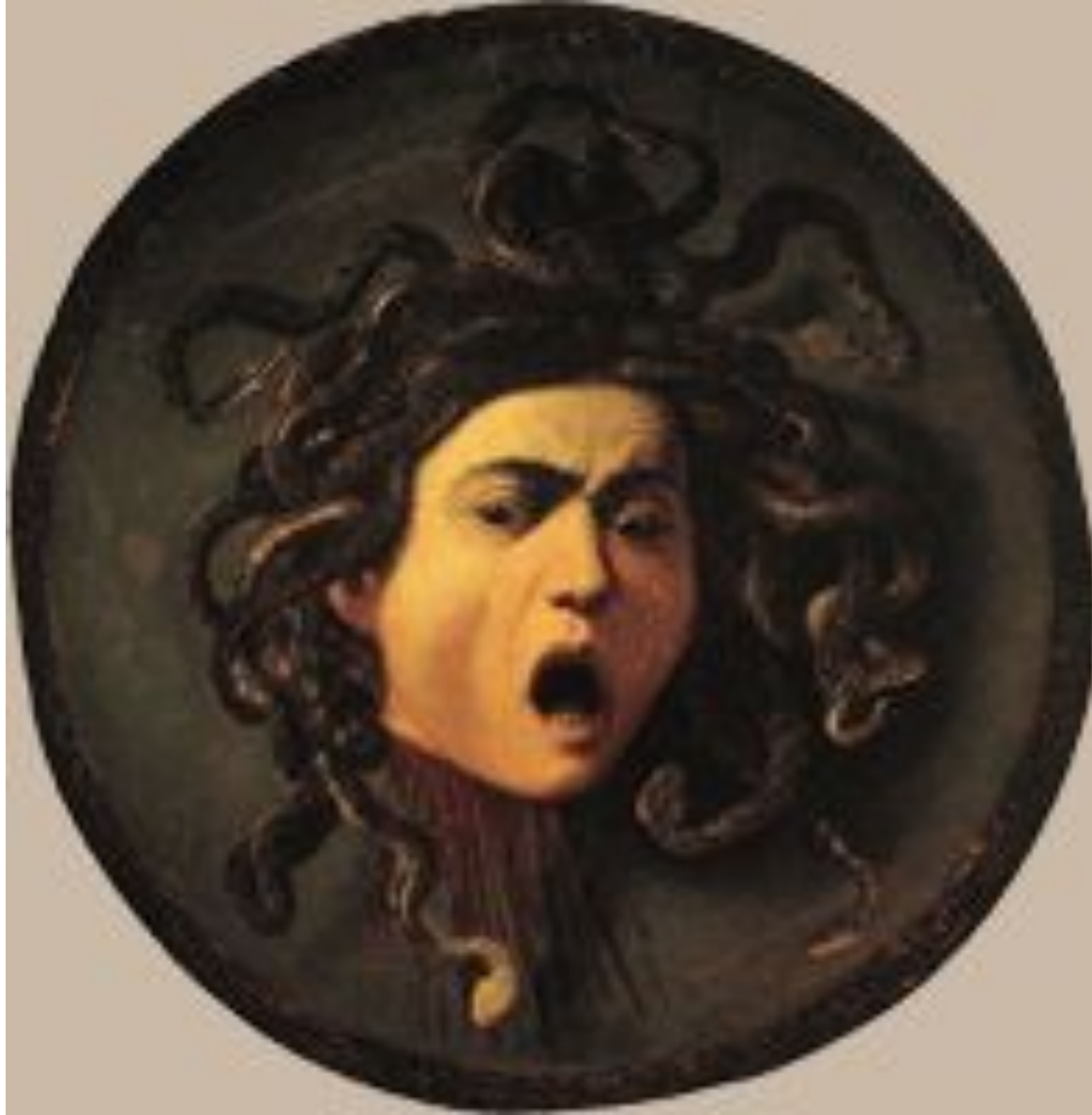
Голова Медузы Караваджо, 1598-99 г. Галерея Уффици, Флоренция.