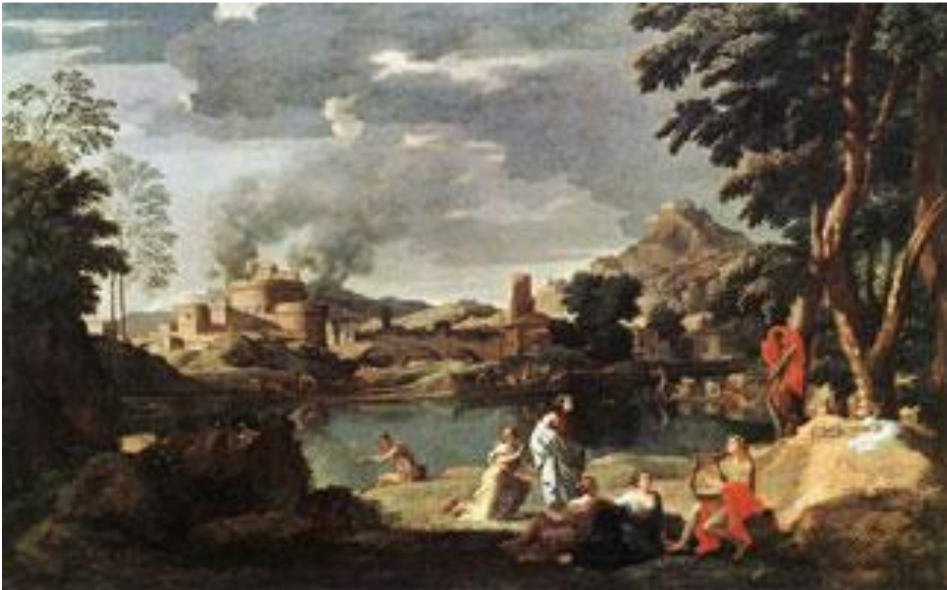
Пейзаж с Орфеем и Эвридикой Никола Пуссен, 1648 г. Париж, Лувр