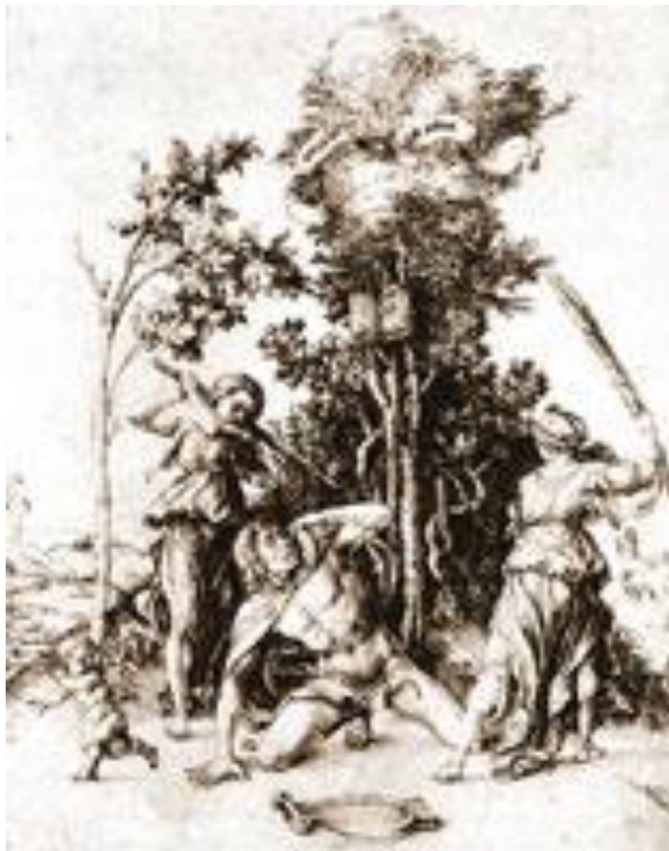
Смерть Орфея Альбрехт Дюрер, 1494