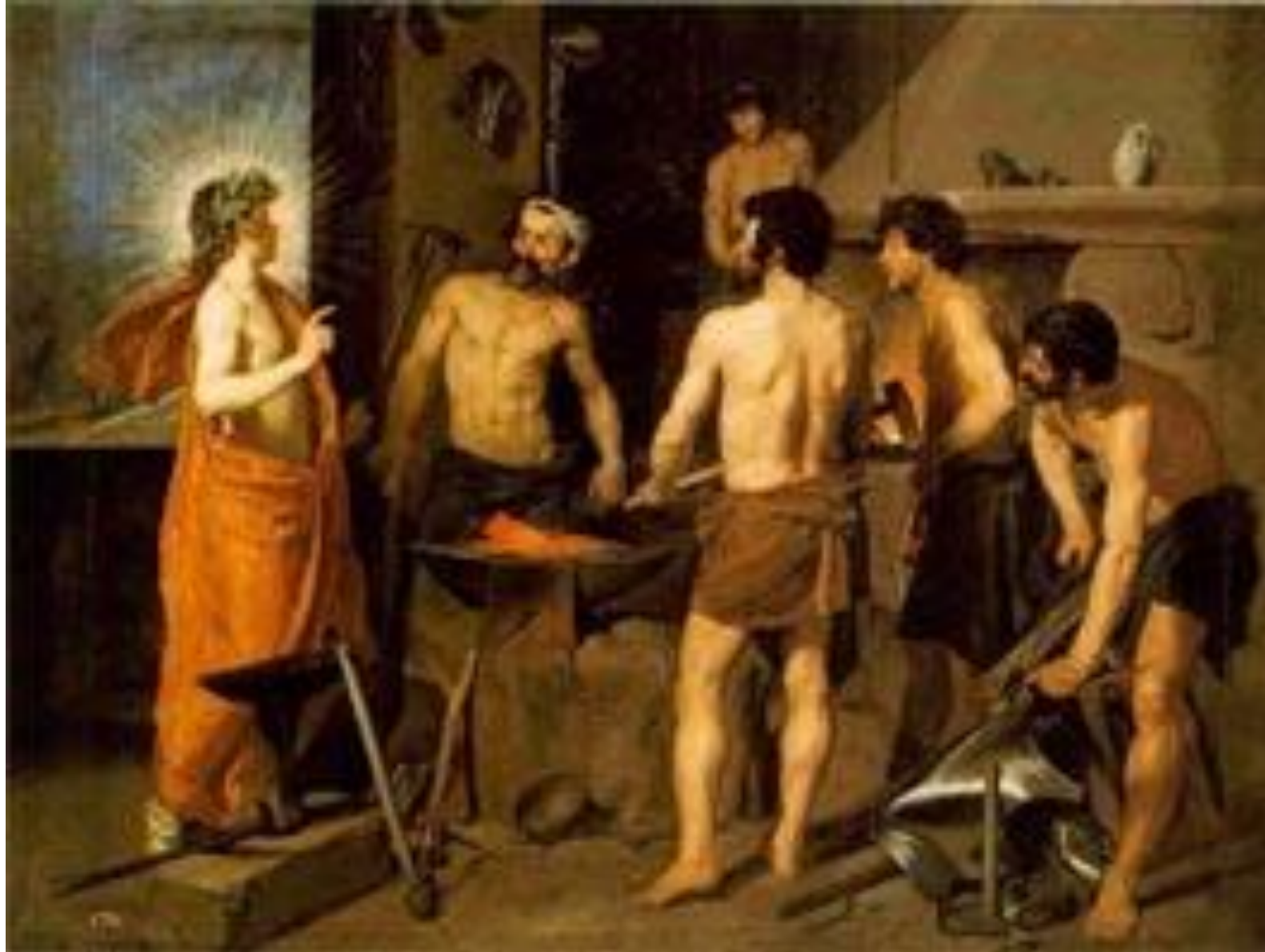
Кузница Вулкана Диего Веласкес, 1630 г. Мадрид, музей Прадо