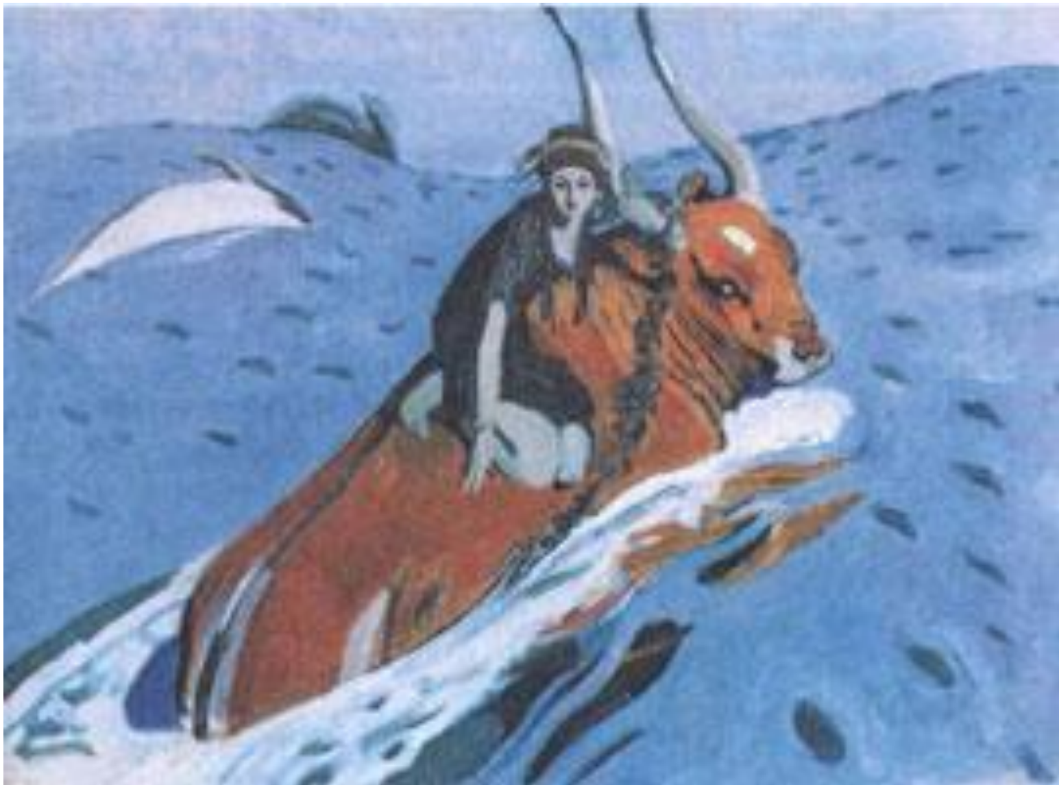
Похищение Европы Валентин Серов, 1910 г. Москва, Третьяковская галерея