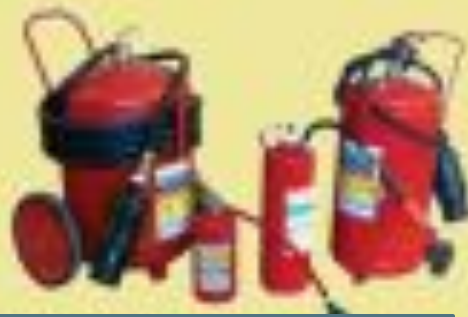
ОХП (химические пен)