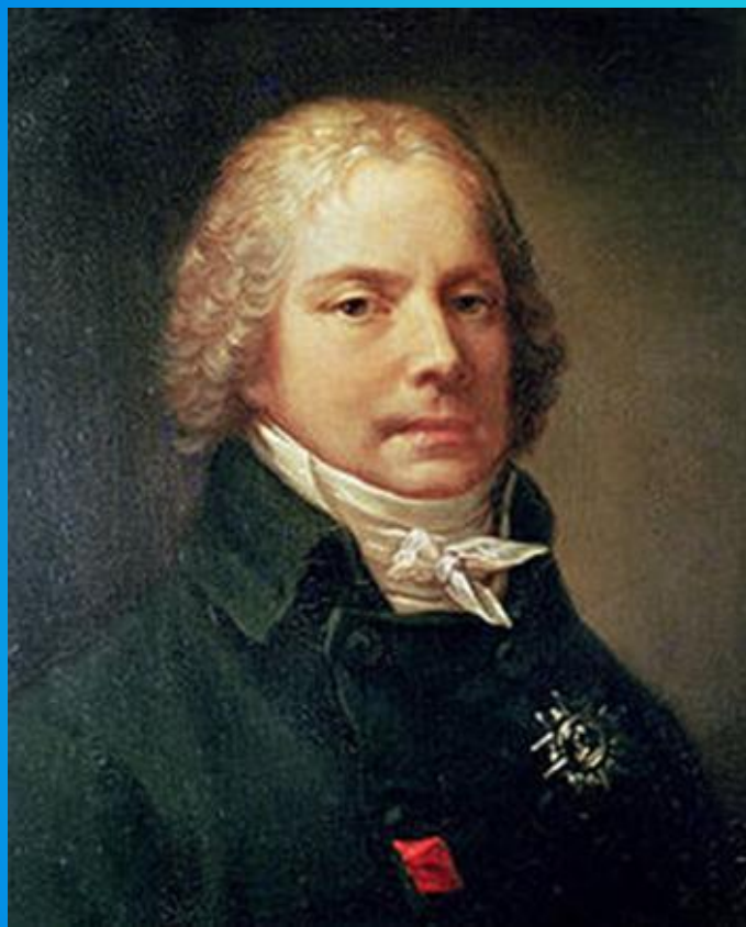
Шарль Морис де Талейран – Перигор, князь Беневентский